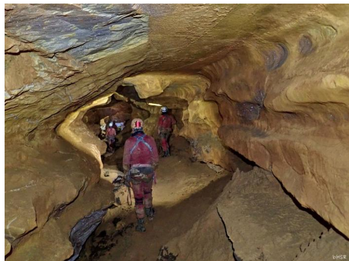
belle galerie.

Nous prenons le chemin de retour et déséquipons. Quelques photos de Bertrand :