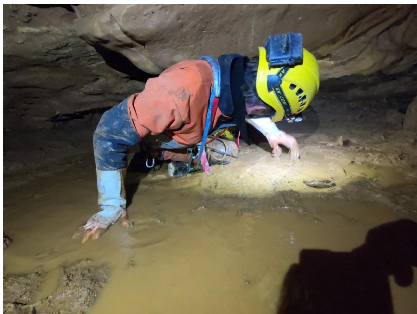
la flaque (au retour).

Ensuite il faut ramper sur le côté d'une flaque en essayant de limiter le « trempage ».