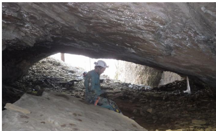
Entrée de la grotte de la scierie vue de l'extérieur et de l'intérieur.