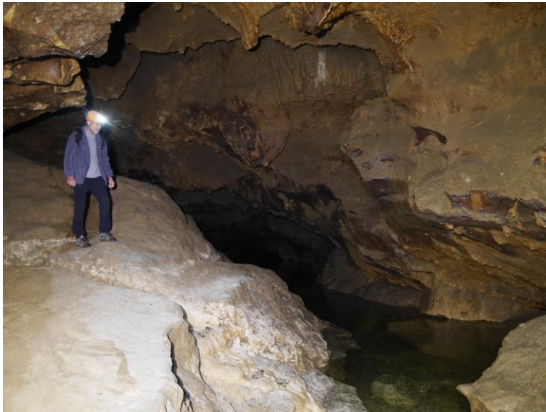
La rivière côté siphon amont.