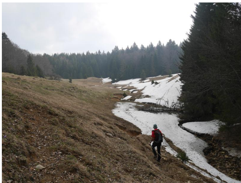
vers les pertes de la Benoite.

Ensuite nous allons faire un grand tour sur la montagne de Banges-Prépoulain, via le secteur des Pertes de la Benoite, où se trouve l'entrée supérieure du réseau de Prérrouge, le plus long et le plus profond de Savoie.