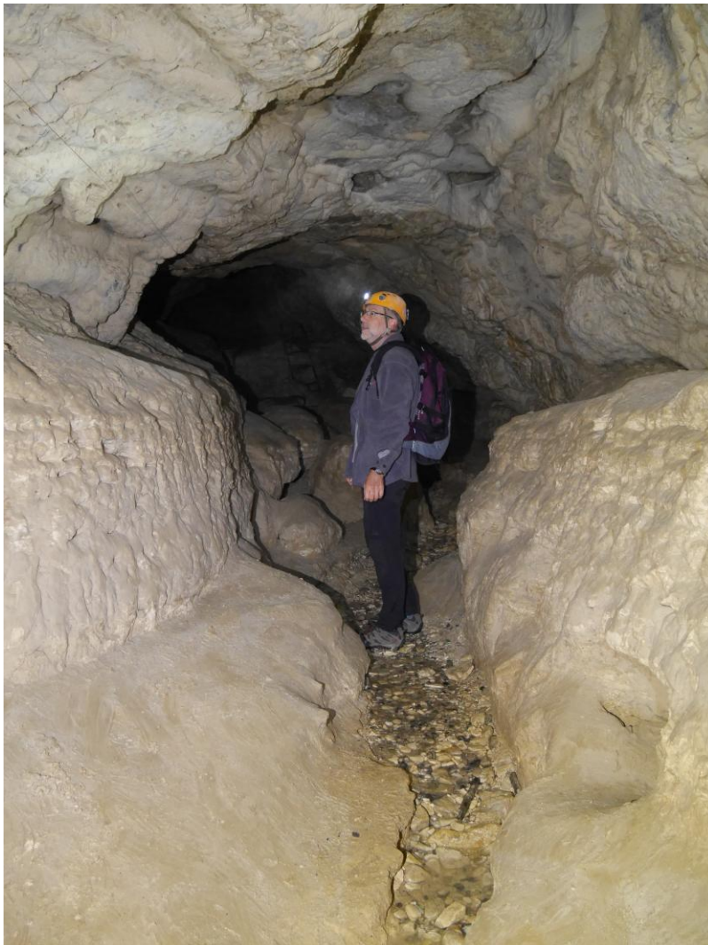
Bien que descendant à -70 environ, la visite se fait en tenue légère !