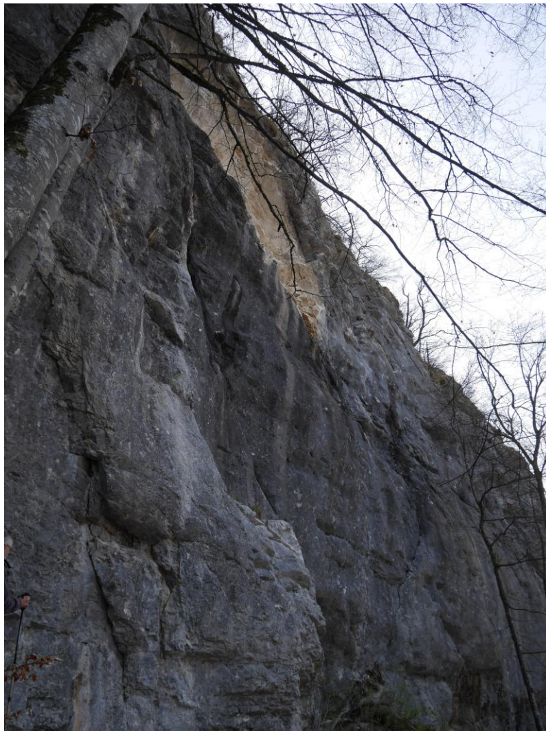
la « plaie » dans la falaise...