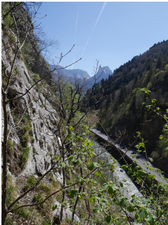
Du porche, vue sur le Fier et les dents de Cruet-Lanfon.

Il ne me reste qu'à remonter en déséquipant. D'autres ouvertures restent à voir, notamment au-dessus de cette cavité, mais je n'y crois pas vraiment.