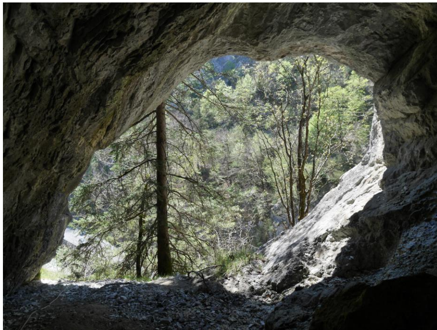
Vue de l'intérieur. La hauteur est de 4 m environ.