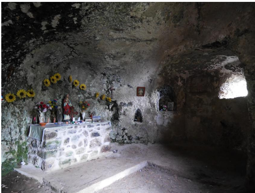
Une chapelle a été aménagée dans une cavité creusée à la pointerolle.