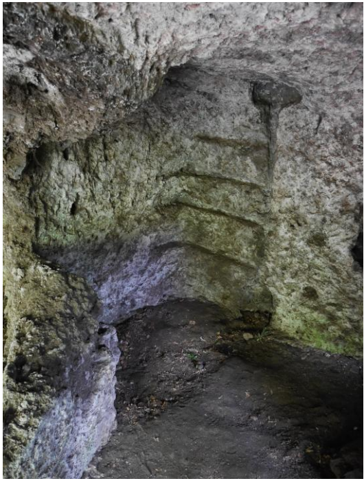
Des traces d'aménagement.