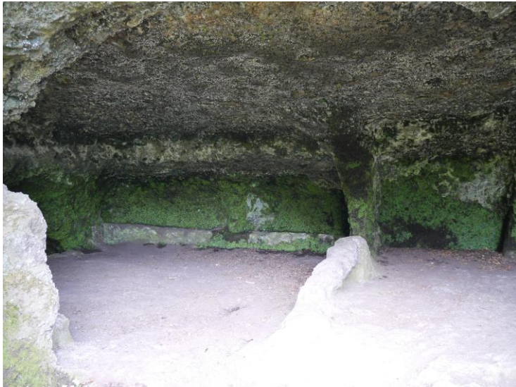
Encore un reste d'aménagement.