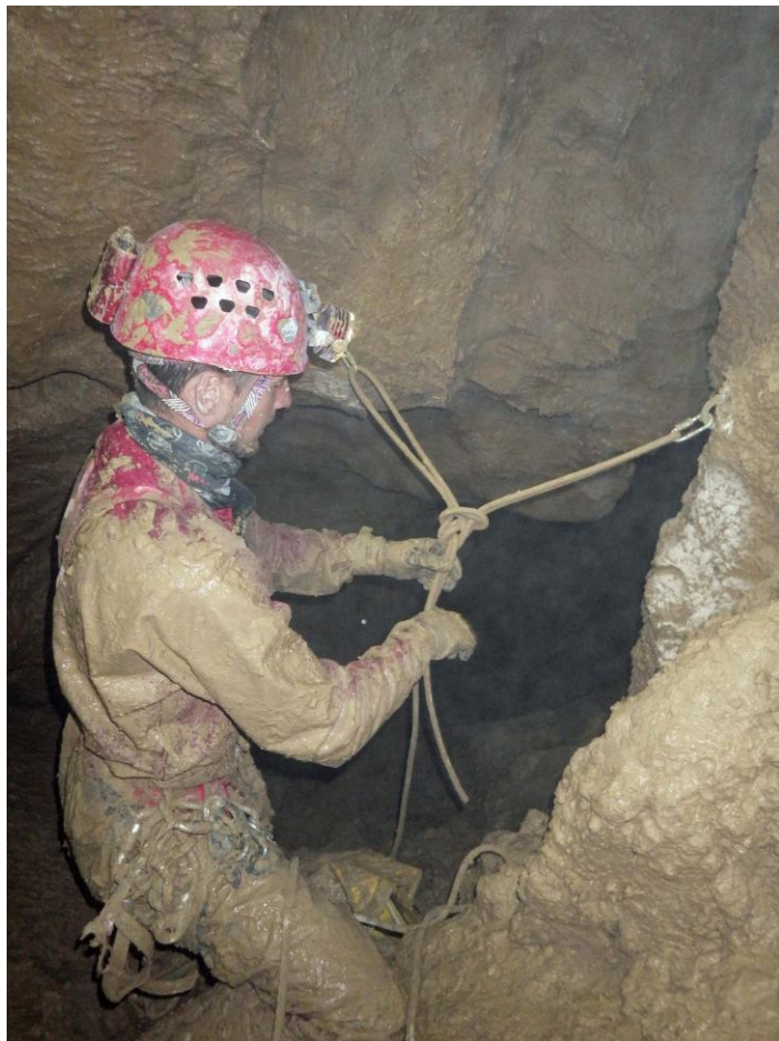
Côte -617, début de la première dans une ambiance hyper boueuse...