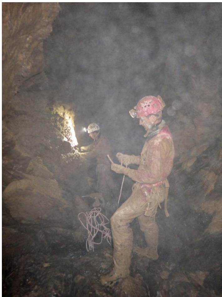
Au sommet du dernier redan, grâce à un petit actif c'est plus propre.