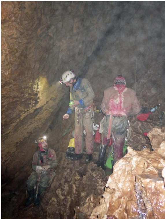
A la descente, pause à -470.

Le « vrai » compte rendu viendra plus tard... Juste quelques photos « documentaires » sur une première qui ouvre la perspective d'un -700 dans le Jura.