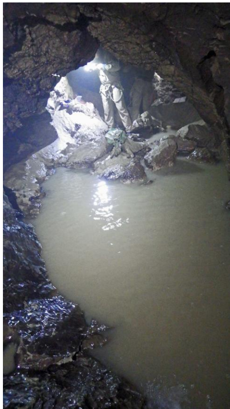
la vasque avant le siphon.