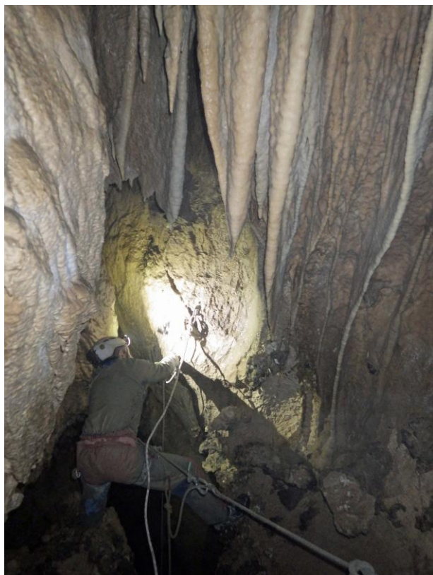
Changement d'une corde usée vers -300.