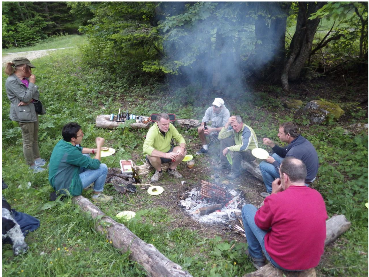
En surface, l'accueil est bien sympathique !