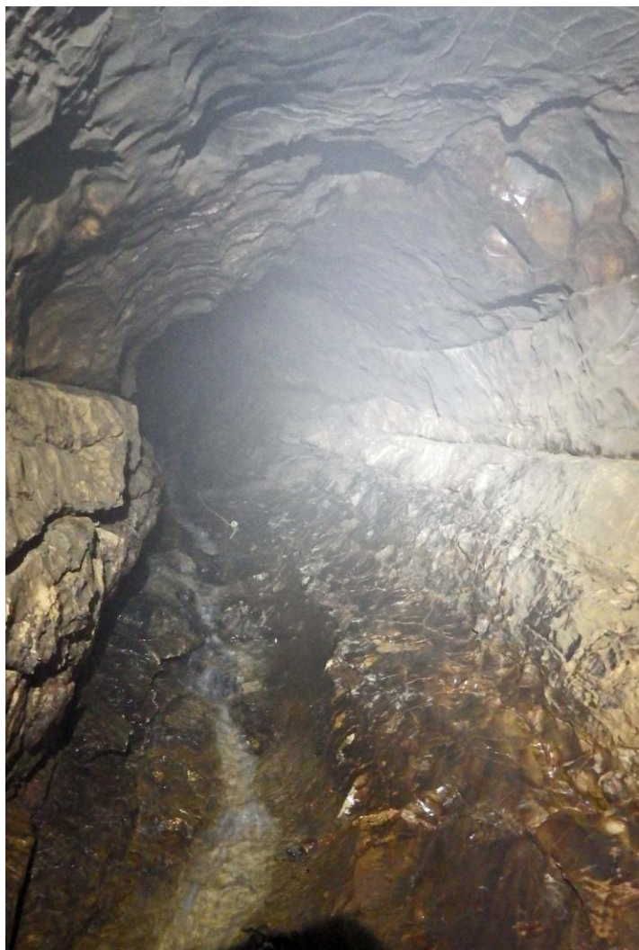
La conduite forcée terminale. On voit le bout de la corde. Le sol est très glissant. Le joint de strate est bien visible.