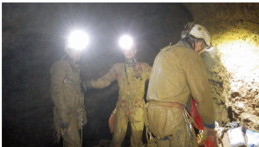
Les trois collègues au fond.