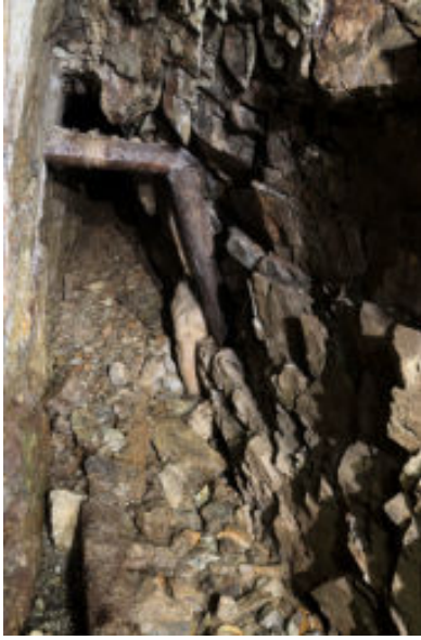
Un boisage. Derrière, c'est effondré.