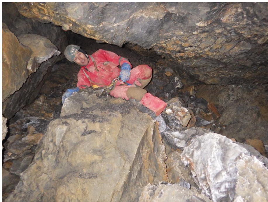
On se faufile entre des blocs de toutes tailles !