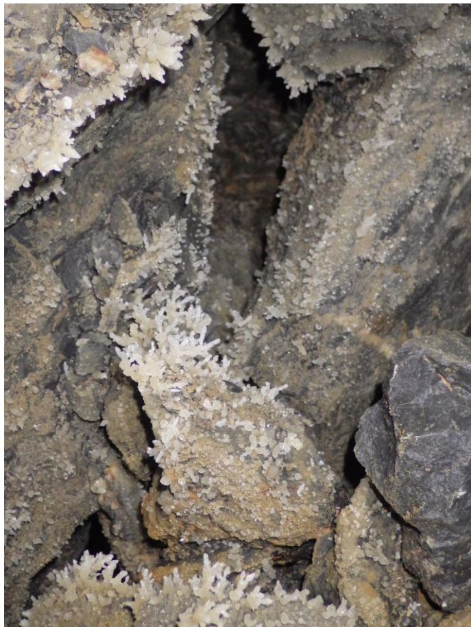
Les blocs sont parfois couverts de petites mais sympathiques concrétions.