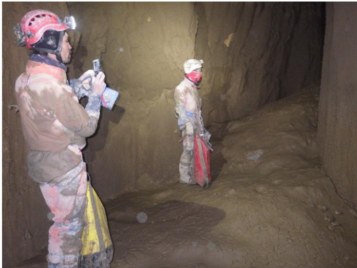
Une première boueuse !