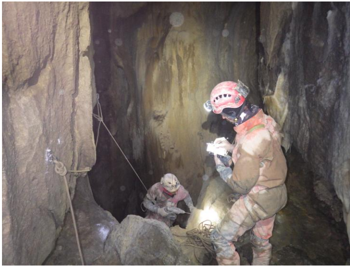
Sur le palier dans le dernier puits.