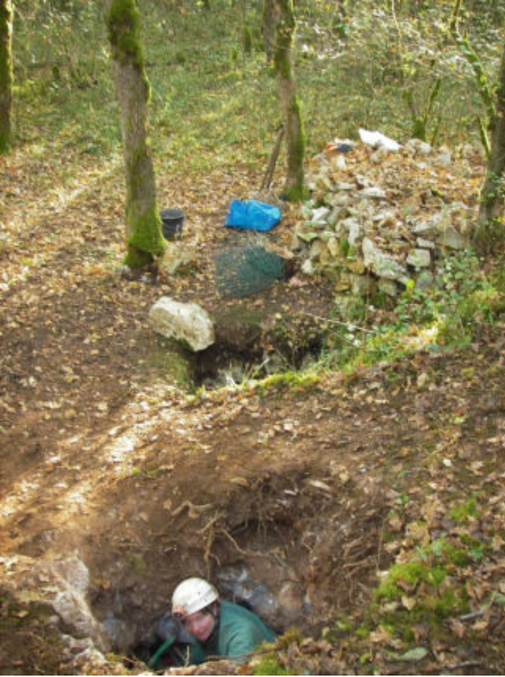
Mathilde en oppo purge les parois de la nouvelle entrée.