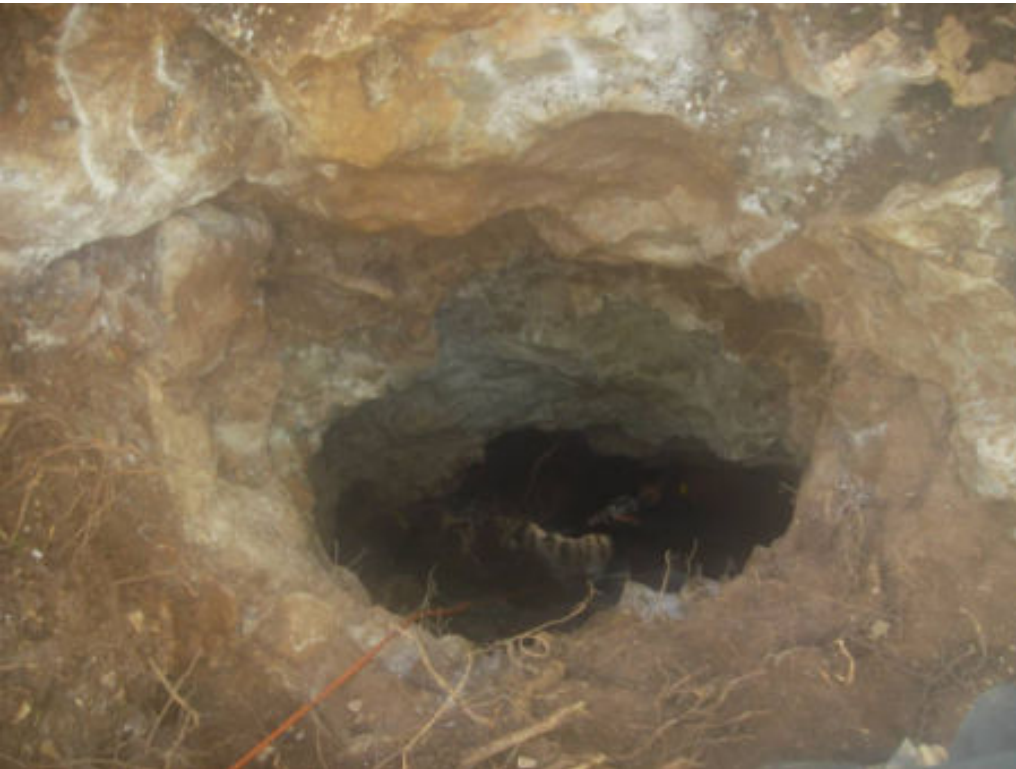
Dominique au perçage en bas de la nouvelle entrée