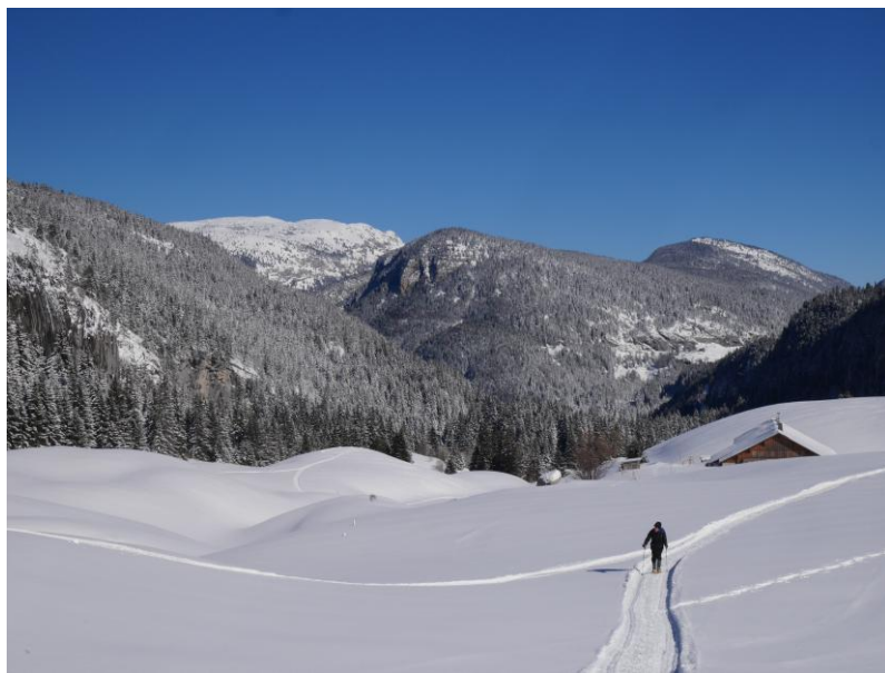
le chalet d'Ablon.

Après la prospection que nous avons faite il y a cinq jours j'avais envie de faire une longue balade-reconnaissance de tout le secteur. C'est ainsi que nous nous apprêtons par un froid vif, accentué par un zéphyr glacé, au lieu-dit Paccot au centre géographique du plateau des Glières. Nous décollons peu après 10 h direction la plaine de Dran puis la piste qui descend vers la vallée d'Ablon. Nous remontons cette vallée où, grâce à des traces de Skidoo, nous pouvons laisser les raquettes sur le sac jusqu'au-delà du chalet d'Ablon. Celui-ci a été réquisitionné par les militaires qui se sont baladés un peu partout sur leurs engins motorisés.