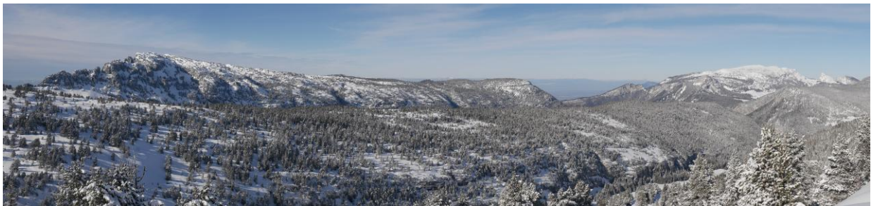
Derrière les forêts de Mont Téret, tout le plateau du Parmelan et Sous-Dine.