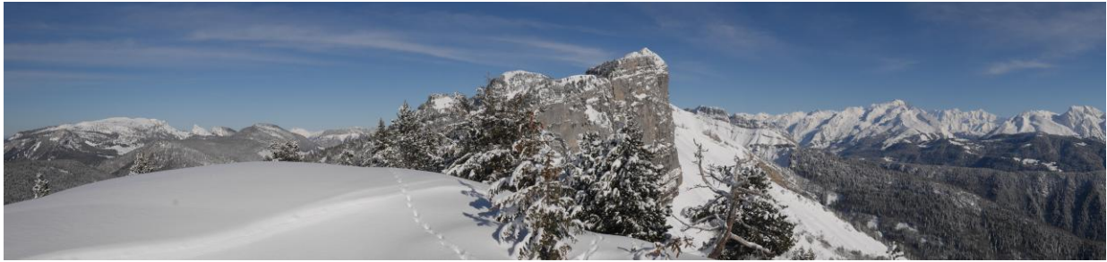
De gauche à droite, Sous-Dine, Tête de l'Arpette, Mont Blanc et Aravis.

On remonte la croupe vers le Nord, elle est aérienne sur la droite marquée par une haute falaise. Par cran successifs, parfois raides, on arrive au point 1716 m avec vue panoramique.