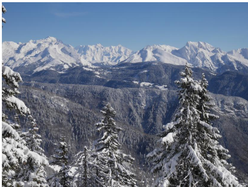
Mont Blanc et Aravis.

D'un coup la vue s'ouvre vers le Sud et l'Est, c'est superbe et ici le soleil chauffe !