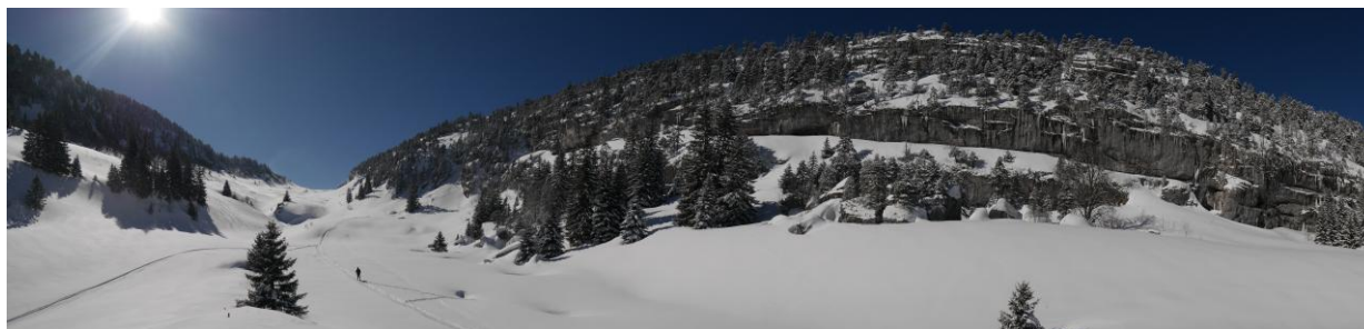
La vallée d'Ablon et les falaises du Mont Téret à droite.