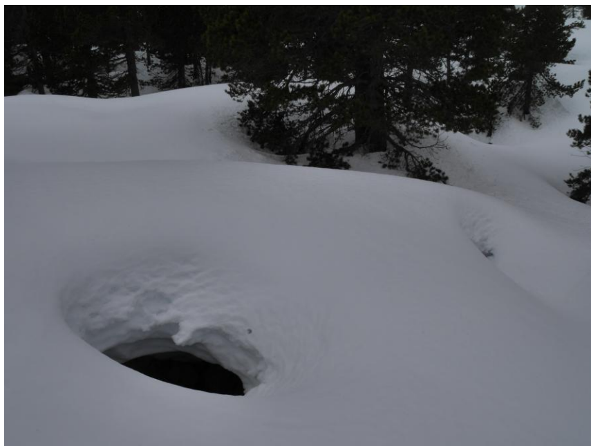
un trou anonyme.