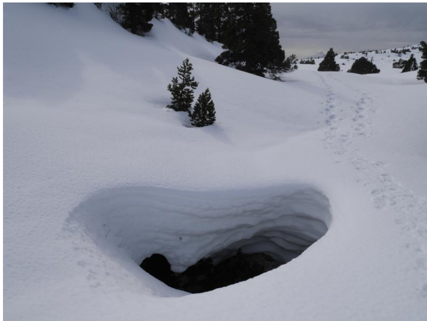
la Tanne du Bois Joli.