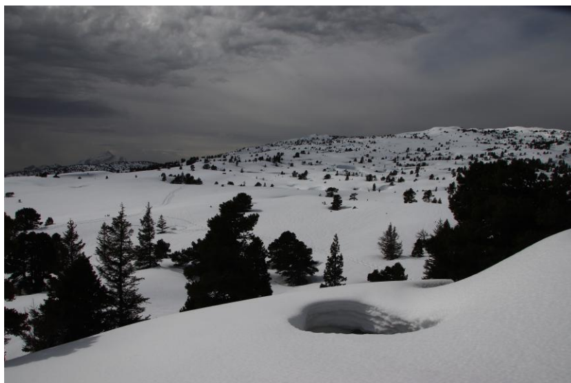
le Petit Trou.