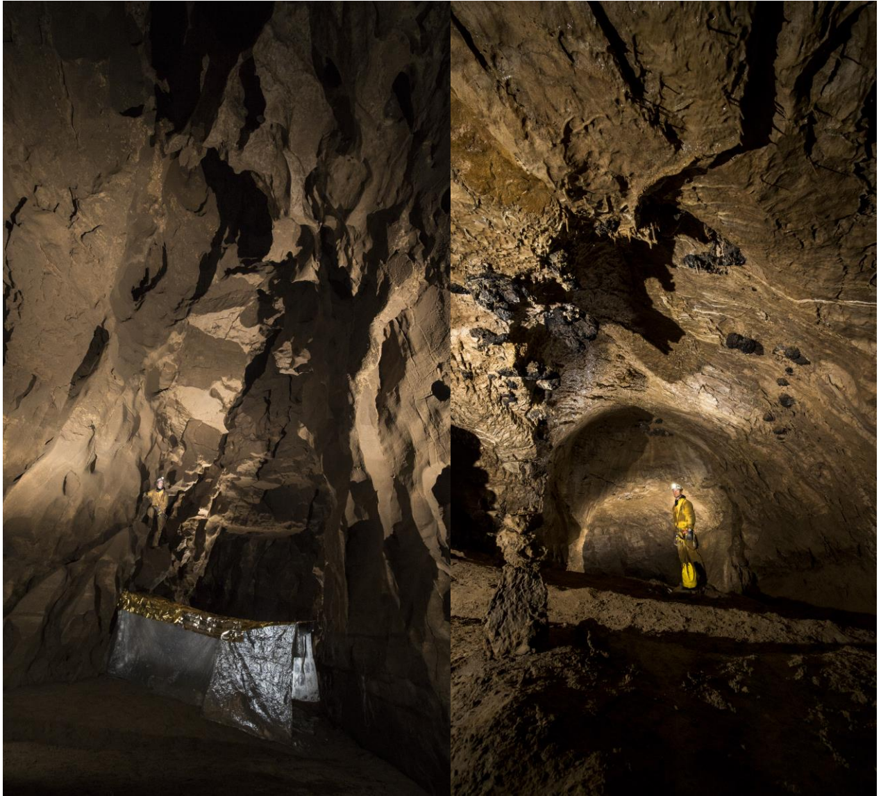
Au gauche la galerie Nord et le bivouac / A droite, une galerie juste après le passage crocodile

On fait demi-tour, on trouve la bonne galerie, passons sous le pont rocheux que nous ratons au retour (donc pas de photos !). Une petite conduite forcée nous amène à l'orée d'un noir immense : « La salle Phygrane ».