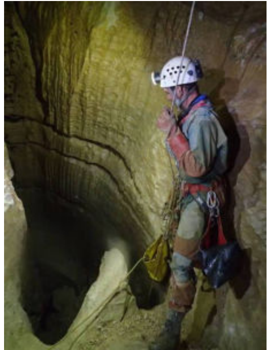
Le fond de la première partie (40m). On voit le relais suivant 6m plus bas et le départ du puits de 26m qui fait suite(zone noire)