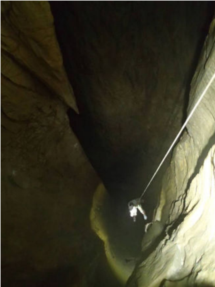
Le grand puits (jet de 40m)