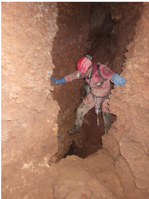
traversée du redan.