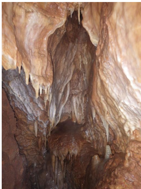
le plafond de la galerie à -75.

Avant de repartir vers Annecy nous allons visiter le haut de ce gouffre que d'autres ont équipé hier. Succession de 5 puits de 10 à 15 m coupés de passages plutôt étroits, puis une belle galerie à allure de méandre, mais rectiligne et horizontale avec un concrétionnement agréable. Une traversée et quelques redans remontants terminent la visite pour nous (le trou fait plus de -400 mais est très étroit dans ses parties basses). Photos, puis nous déséquiperons et évacuons le matériel. Du tourisme donc !