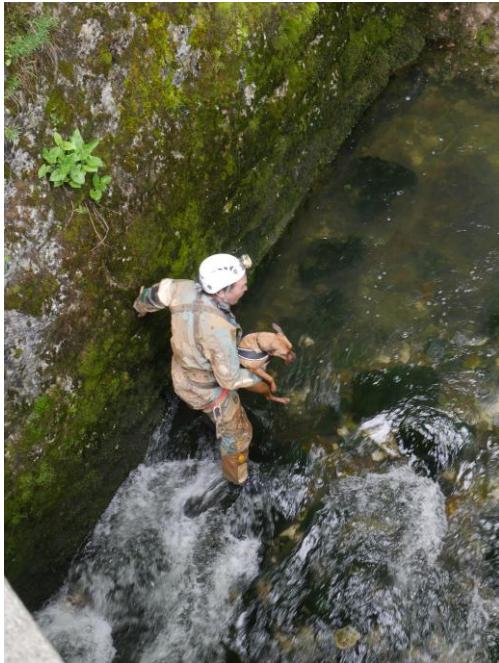
Il part avec son colis sous le bras.