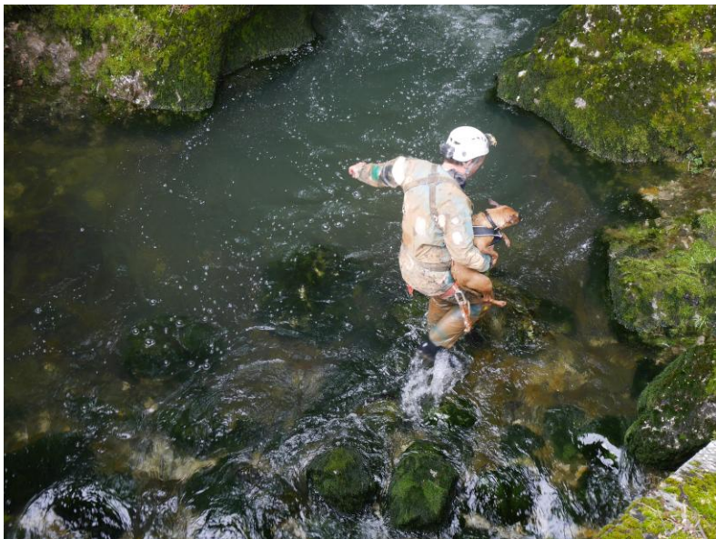
presque sauvé !