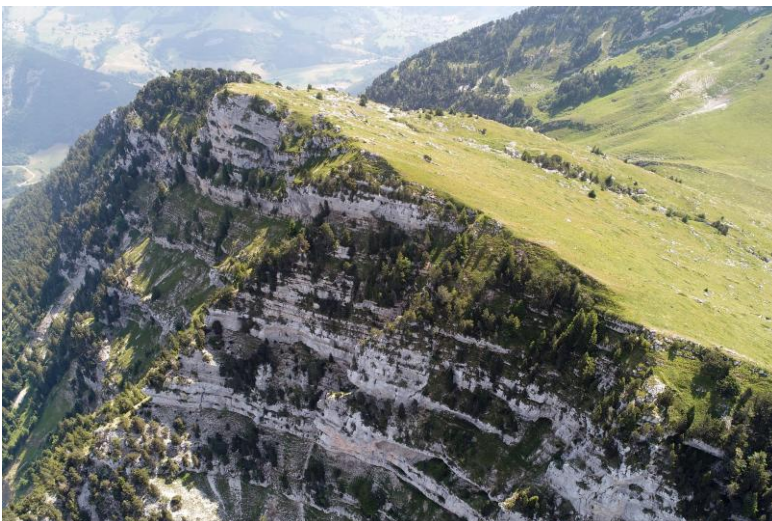
Les falaises versant NW.