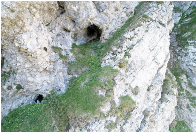
Deux porches à voir.

Aujourd'hui je dirige mes pas vers le col séparant le Colombier de la Dent de Rossanaz, via la Combe du Cheval, au départ d'Aillon le Vieux. Arrivé sur place je me décale au pied des falaises de Rossanaz et pose la piste d'envol du drone en équilibre sur un vague replat. Je veux aller ausculter les falaises qui me font face vers le Sud car elles sont situées à l'aplomb du gouffre des Lézards dont une galerie doit sortir en surface dans le secteur. Et c'est parti.