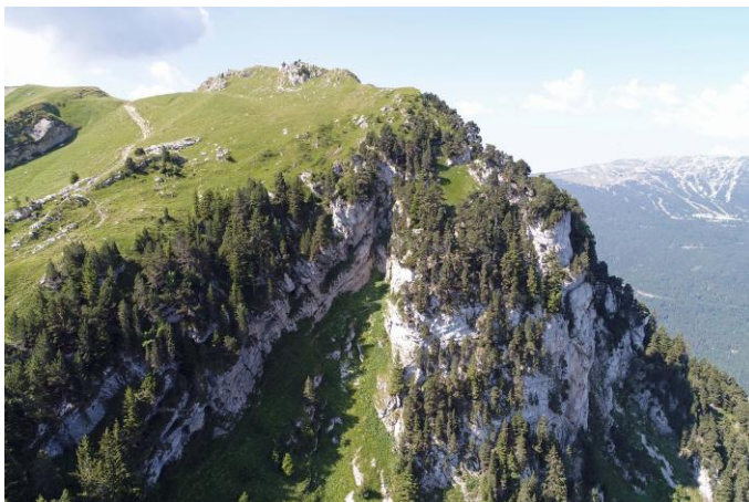
Vue générale de la falaise.