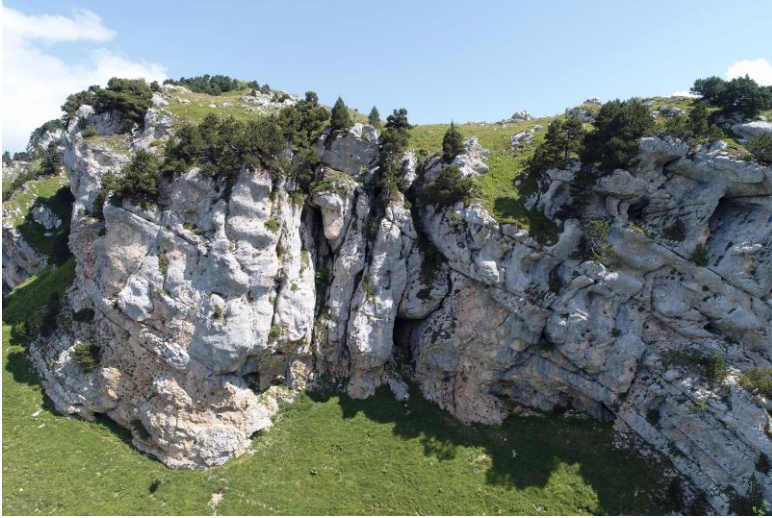
La paroi bordant Rossanaz au Sud, au milieu la fissure de Rossanaz (soufflante).

Ensuite je vais poser du matériel à Parada puis m'installe près du gouffre des Lézards pour envoyer le drone vers la dent de Rossanaz.