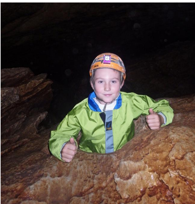
...celle-ci vide !