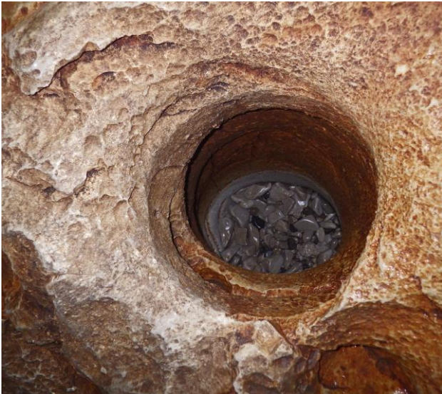
Celle-ci est humide...

Remontée jusqu'au siphon avec de multiples marmites de toutes tailles sèches ou pleines selon le cas.