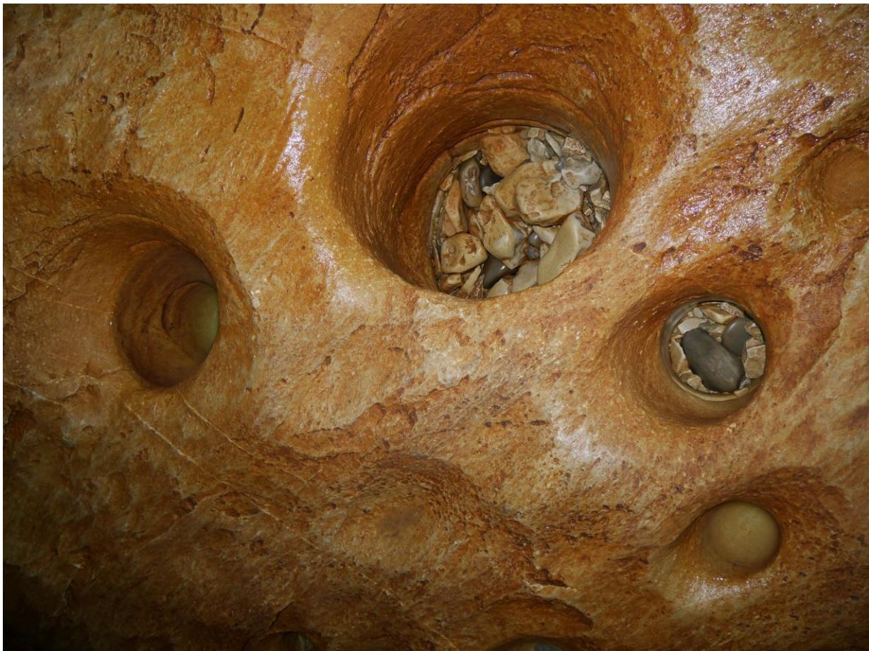
Micro-marmites dans le lit du ruisseau souterrain.

Le niveau est très bas mais limité par le seuil du déversoir.