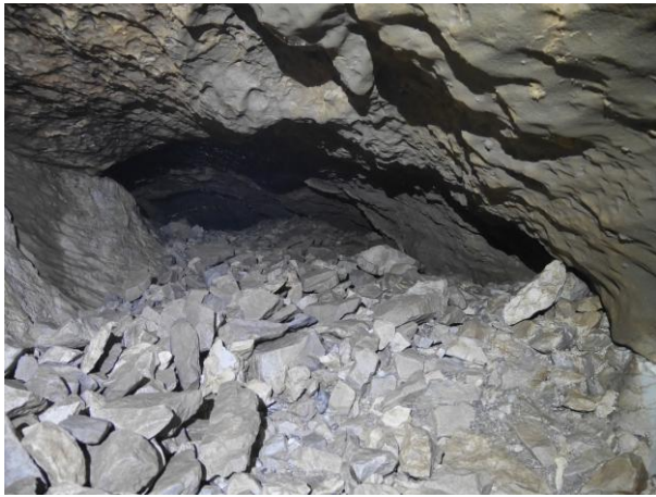
La galerie d'accès.

Mais, si le niveau est un peu inférieur à celui habituel, il n'y a rien à espérer !