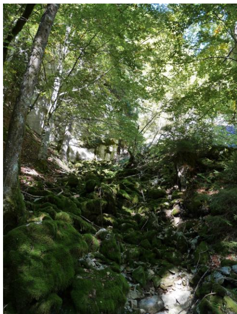
L'entrée est derrière les feuilles.

Balade express aujourd'hui, je monte à l'exsurgence du Lindion, trop plein de celle qui draine toute la partie haute du synclinal du même nom donc notamment le Réseau des Marmottes et la Grotte du Maquis. La fraîcheur et le sac très léger m'autorisent un parcours en 33 minutes pour les 450 m de dénivelé jusqu'au talweg en contrebas du porche.