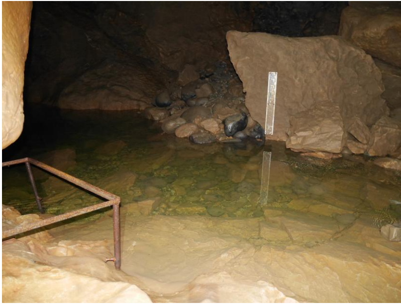
Départ du siphon.

Puis je vais, de l'autre côté de la vallée, revoir le siphon amont de la grotte de Morette, déjà visité en août avec mon petit-fils Malo. Là, rien de nouveau non plus.