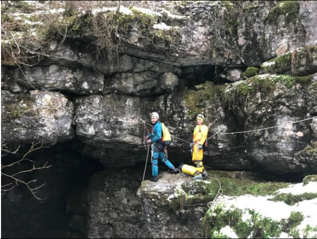
Le départ de la descente