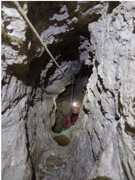
départ du puits Dobrilla.