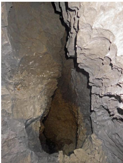
Le ressaut élargi