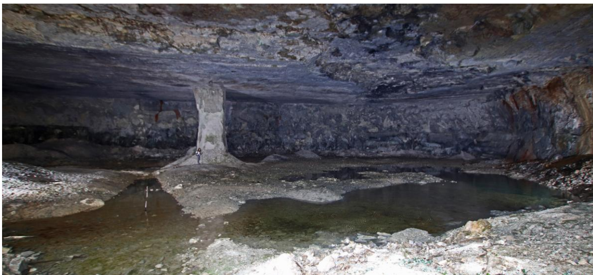
Un pilier bien modeste vu les dimensions (Isabelle donne l'échelle juste devant) !