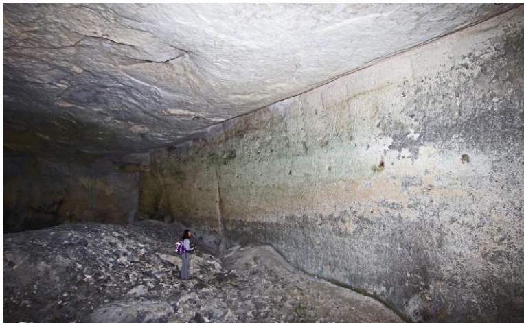
un joli front de taille.

Entre deux escapades à vélo un petit tour aux carrières romaines de Surjoux pour prendre quelques photos de celles situées le plus au Nord, l'avant dernière notamment, et d'une inscription que je n'avais pas remarquée auparavant. Le Rhône est à son niveau maximum et il y a des cascades de partout, belle ambiance !