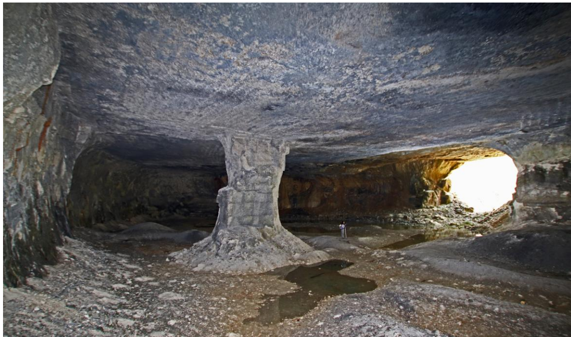
Une autre vue, avec l'une des entrées. Cette excavation est celle qui a le plus haut plafond. C'est l'avant dernière vers le Nord.