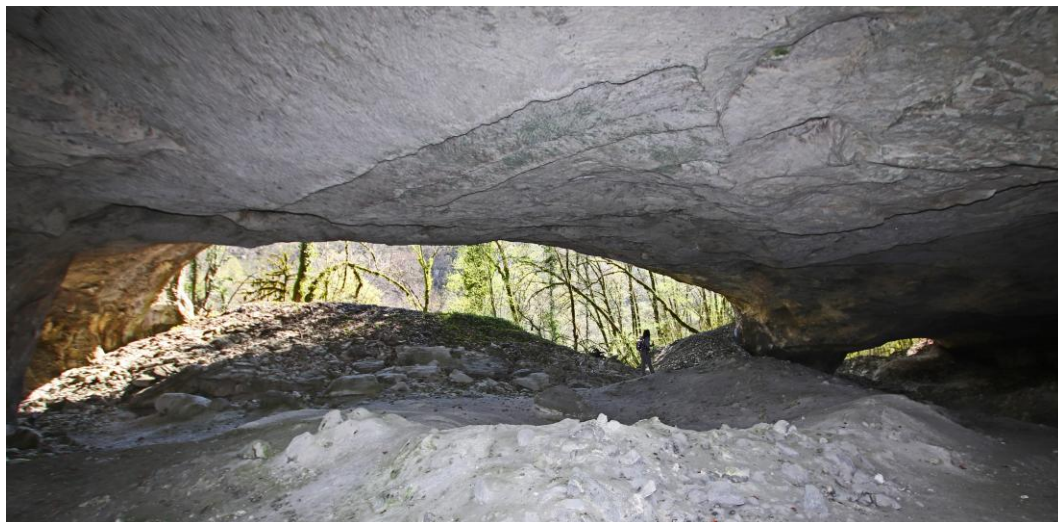
Les entrées de la carrière la plus au Nord.