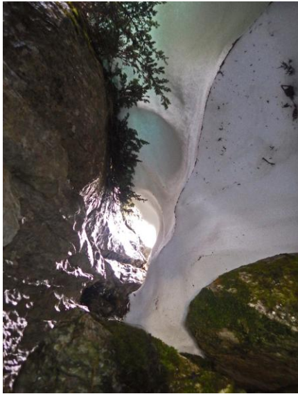
L'entrée intermédiaire enneigée.

Nous terminons par la topo du fond, soit au total près de 90 m de galeries.