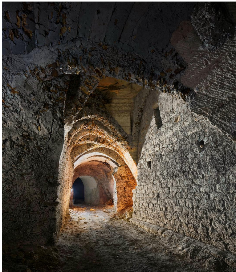
Consolidation du roulage d'entrée, au niveau des travaux anciens

Après cette petite séance, nous ressortons tranquillement, à cette heure-ci, maître clébard dort profondément !