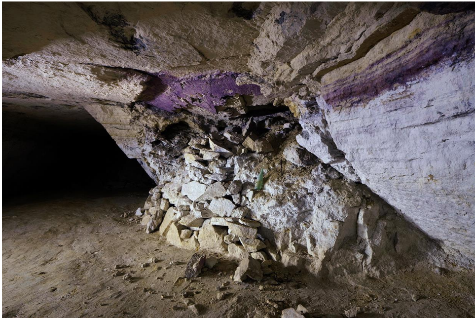
Le banc violet, même pas retouché !

Après cette petite séance, nous ressortons tranquillement, à cette heure-ci, maître clébard dort profondément !