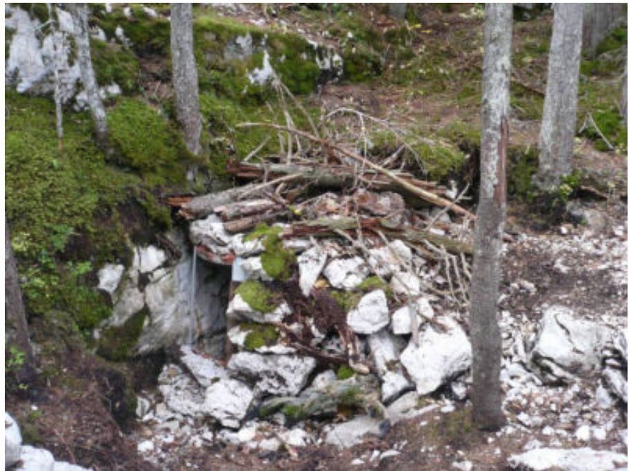
(On dirait une borie du Lot !)

Le reste de la matinée est consacrée à jardiner autour de l'entrée, pour rendre le site "dans son état naturel" :