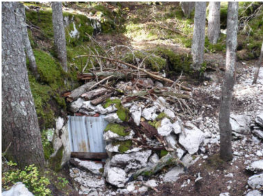
(avec la porte en place pour l'hivernage du trou).