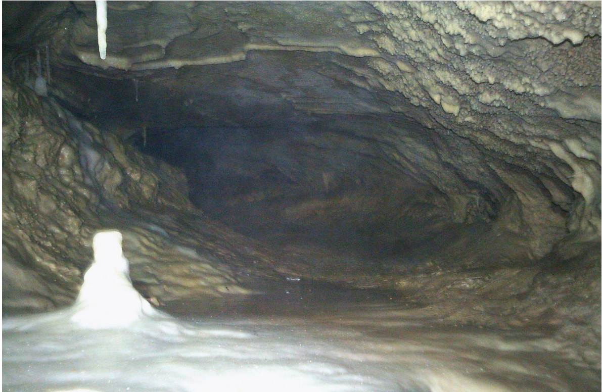
boyau en bas du P12 escaladé

tard : le puits de 12m est vaincu. En haut : cela continue. Malheureusement, cela se divise en 2 branches. Sur la gauche c'est impénétrable mais une grande partie du courant d'air semble partir là bas et sur la droite c'est un boyau. Vianney s'enfile dans le boyau et déboule sur un puits d'une dizaine de mètre. On le descend. Au fond, il y a une chatière étroite qui donne sur un puits qui est le P12 escaladé précédemment. On remonte en haut et traversons ce petit puits de 10m pour poursuivre le boyau aspirant qui se poursuit en face. La ça devient franchement sale et étroit... Heureusement, après 10m cela devient indiscutablement impénétrable... On fait demi tour en faisant la topographie et en laissant le minimum de corde dans ces escalades.