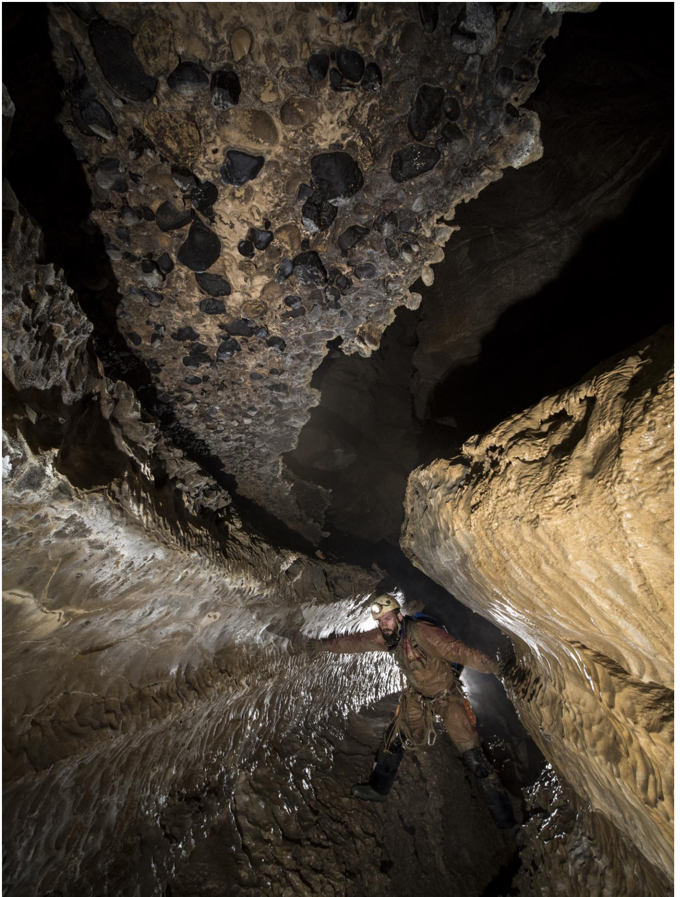
Sur les observations de Jeff, nous photographions ce plafond de conglomérat impressionnant.