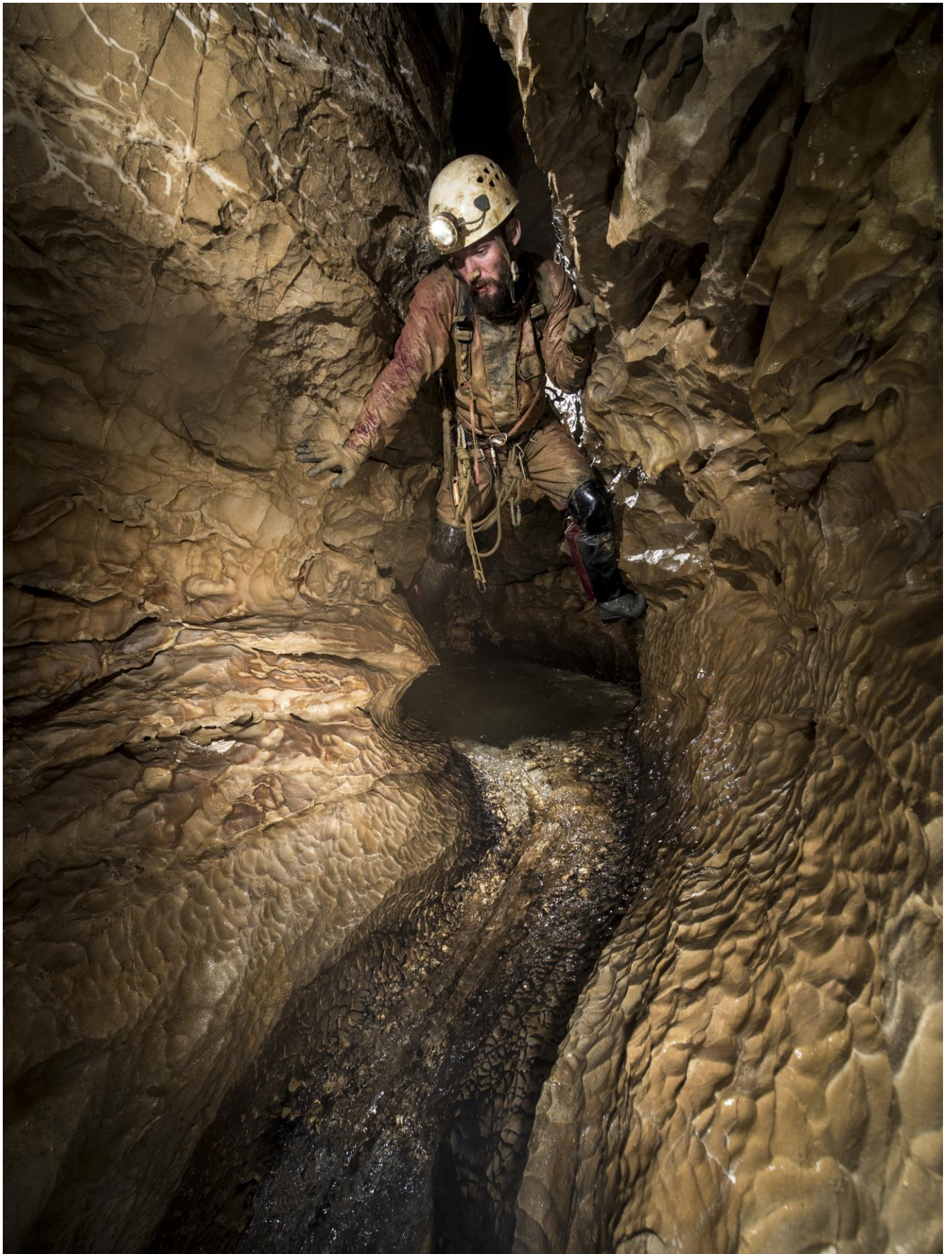
Le fond de la rivière est parfois marqué de remarquables « écailles de dragons »