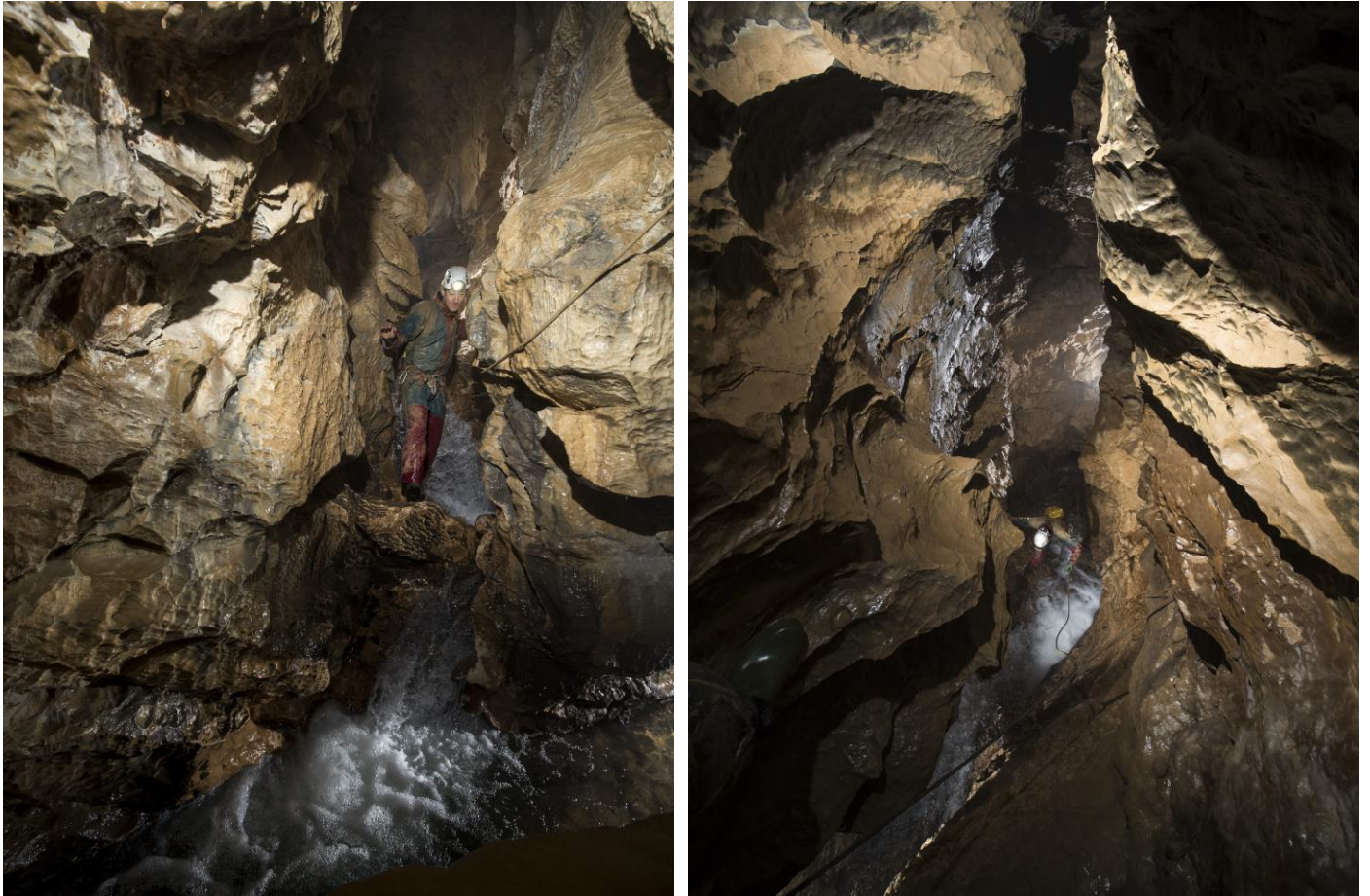
Hervé dans les ressauts de l'aval

L'objectif initial est l'amont, nous remontons donc le puits tempête et retrouvons la main courante qui permet d'accéder de l'autre côté de la cascade et à la suite du réseau. Tout comme l'aval, c'est tout de suite très beau, comme le dit humblement Gilles : « Typique d'une rivière du Vercors » avec quand même beaucoup de cachet !