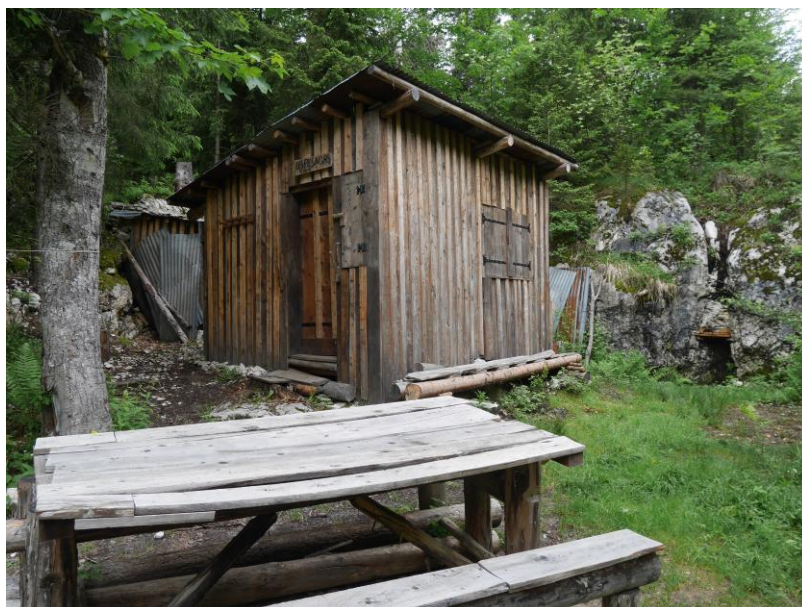
la cabane du Pic Noir.