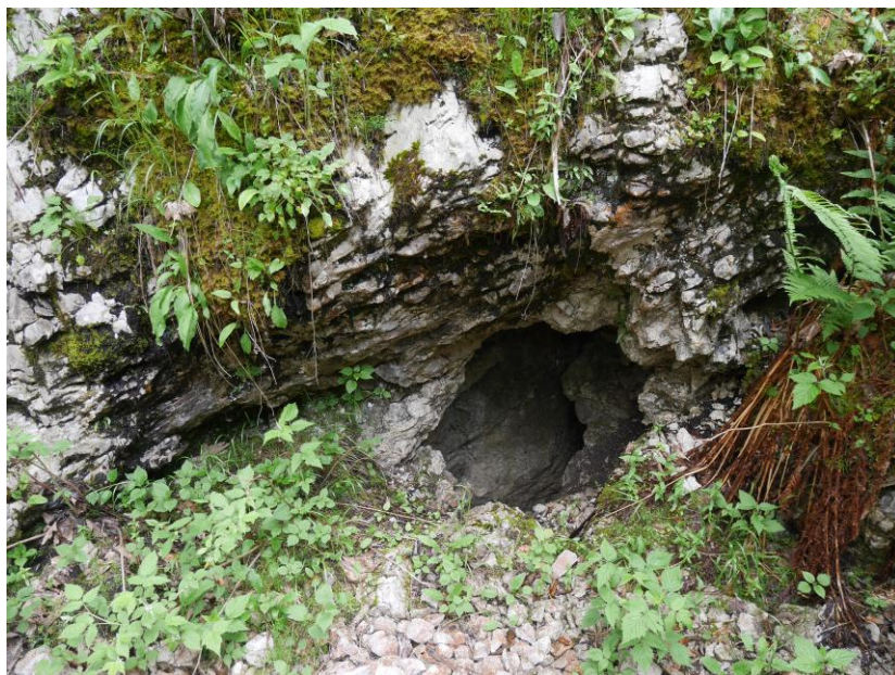
le trou des Pertes.