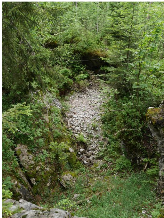
la doline d'entrée du Trou des Pertes.