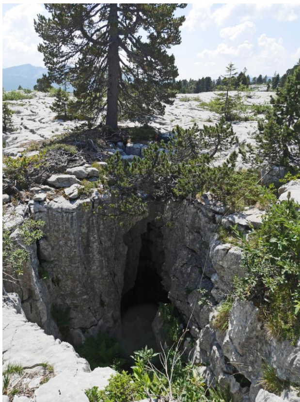
Le premier puits, du bas et du haut .

J'ai retrouvé le RT 104, que j'ai découvert en 1975 et exploré à -115 en 1981.