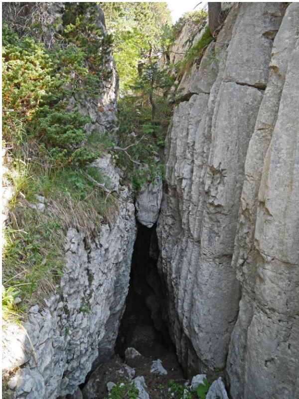
Une des entrées d'un trou très bien placé près de la grotte de l'Enfer.

Bref, encore de quoi faire sur ce merveilleux massif du Parmelan !