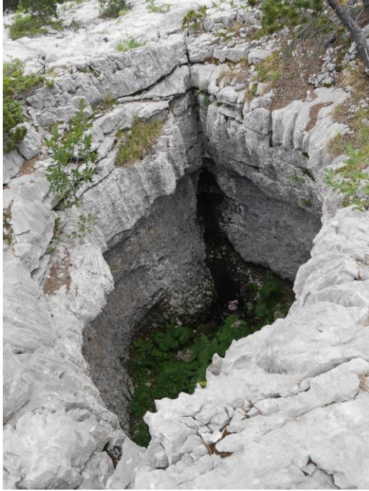
entrée sympathique mais sans suite.