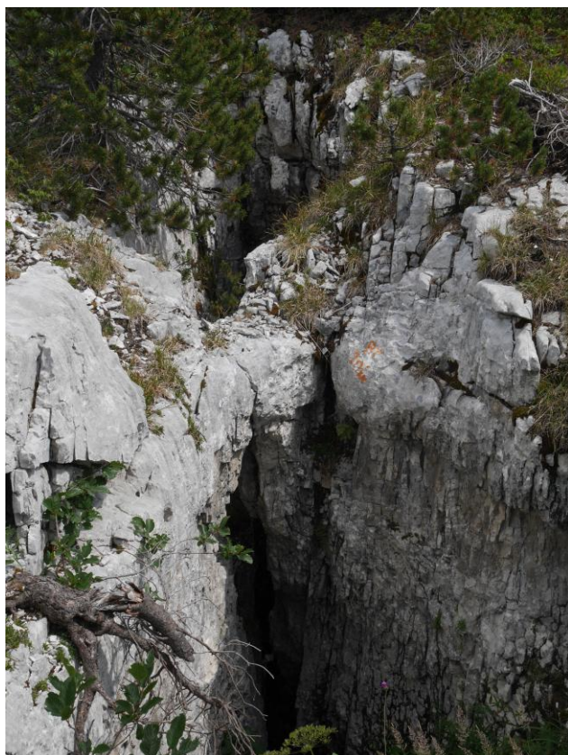
le RT 104.

J'ai retrouvé le RT 104, que j'ai découvert en 1975 et exploré à -115 en 1981.