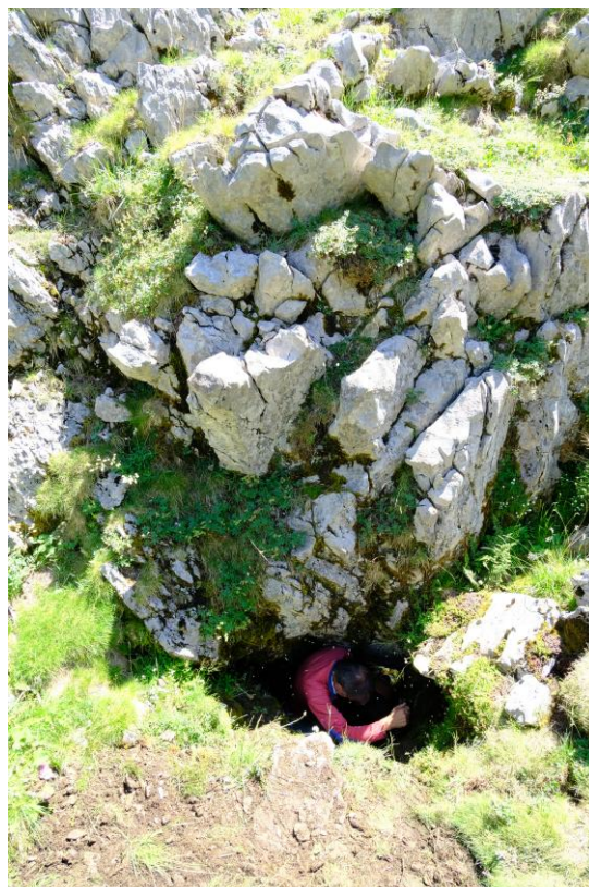
Le trou souffleur, un peu plus bas.

Nous allons déblayer durant une bonne heure mais pour la suite il faudra travailler plus longuement. L'air sort ici à une température de 4°C.