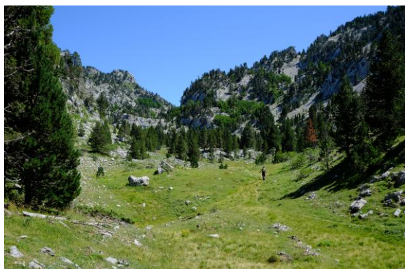
Le haut du vallon.