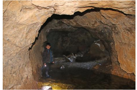
vers l'entrée Nord.