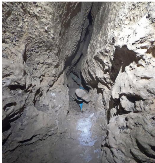
Domi dans la chatière terminale.