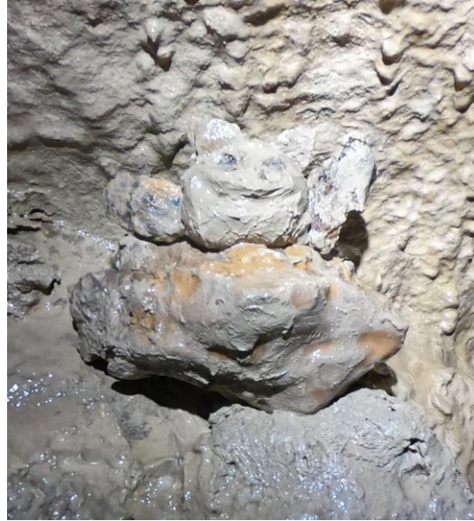
Le chef d'œuvre !

Les copains/copines installent la ligne et remontent, je les suis lorsque tout est prêt et branche la pile avant de décamper. En effet le courant d'air soufflant interdit de s'attarder ici. Retour dans les galeries supérieures, un petit tour pour montrer à notre compagne le grand miroir de faille, en lui recommandant bien de ne pas le briser... Là, pour la première fois, nous trouvons une chauve-souris bien vivante, c'est un scoop !