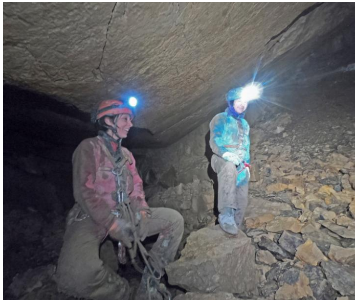
... et la Belle, sous le miroir ! avec son ange-gardien...