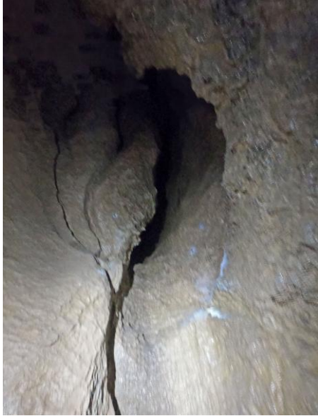
Le départ percé...