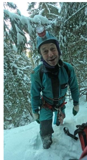
Domi heureux d'arriver !

Le trou aspire nettement et un peu de glace encombre la première montée. Nous atteignons rapidement les grandes galeries, Domi est aux petits soins pour présenter à la Demoiselle du jour « son » trou ! Premier objectif : une collation car les estomacs sont déjà aux abois ! C'est vrai que le départ n'a pas été trop matinal... Puis nous descendons dans le réseau sous la Salle de Satan, galerie ébouleuse de belle taille, passage bas moins rigolo, puits au sommet instable, court méandre et dernière verticale donnant sur un redan modeste mais un chouia délicat. En bas je dois me jucher sur un bloc pour percer à bout de bras 3 trous de 600 mm afin d'ouvrir l'accès à un élargissement prometteur qui permettrait, nous l'espérons, de shunter le boyau trop fin et aquatique qui marque le terminus actuel de ce réseau. Petit