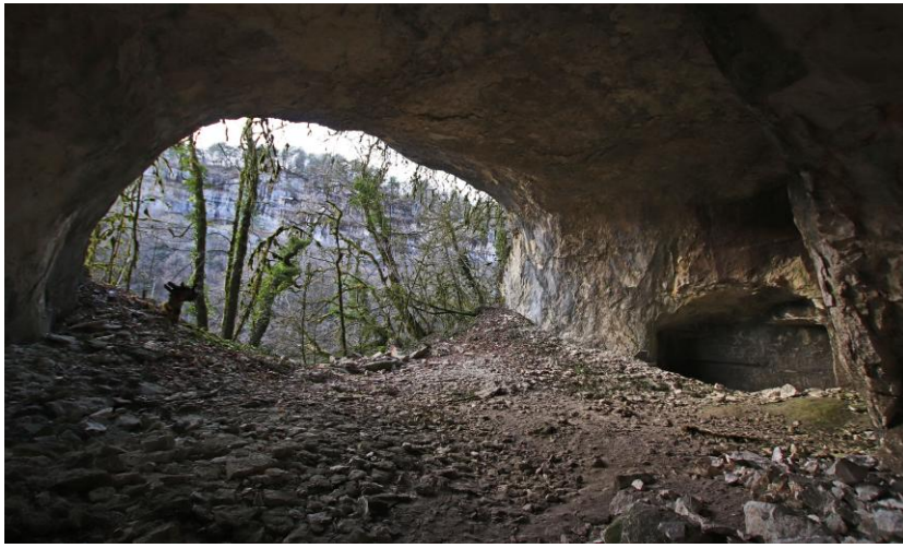
Le porche le plus en amont.