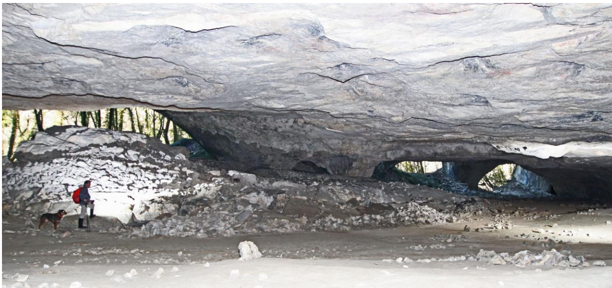
Une vue typique. Orca et Christian à gauche.