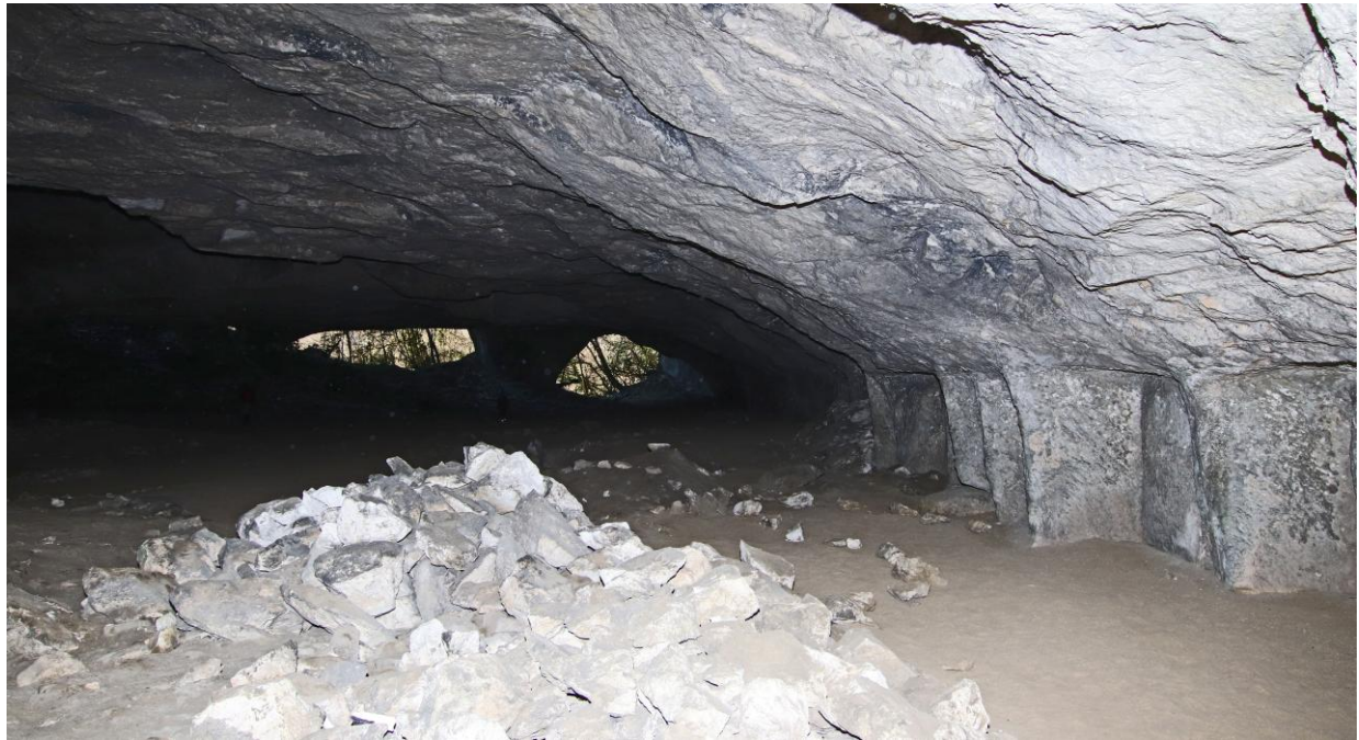
Restes de tailles et un effondrement du plafond.