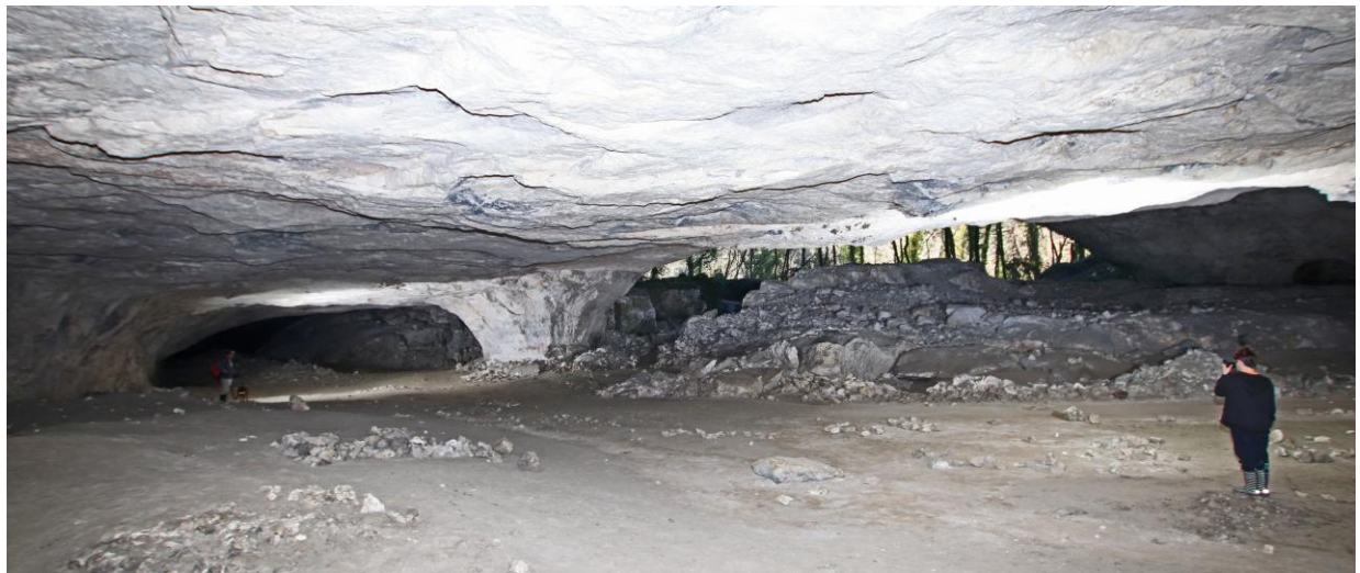
Les quelques piliers semblent bien distants pour soutenir le plafond !