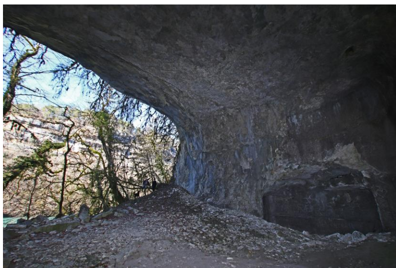
l'entrée Nord (encore).