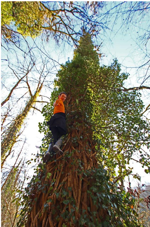
... et l'arbre étranglé !