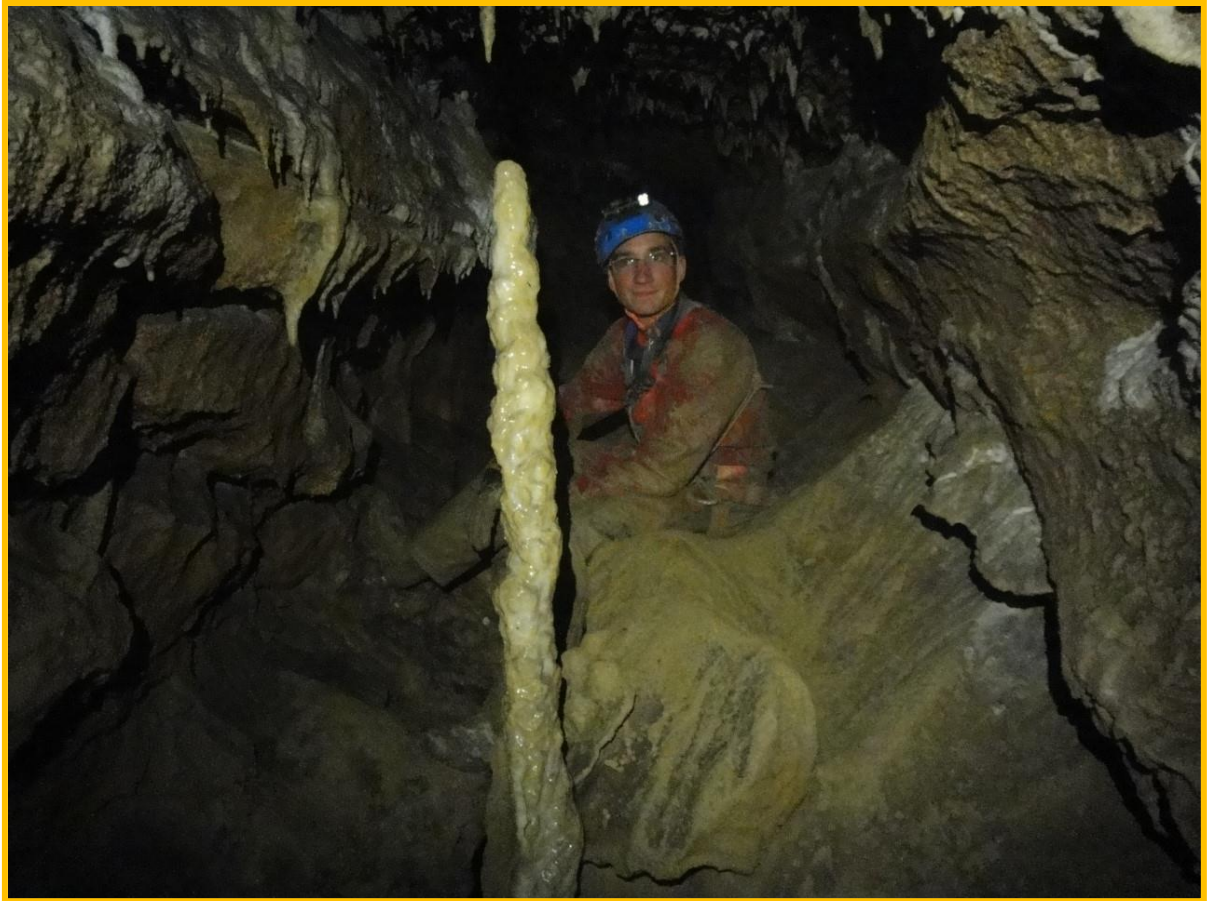
Dans la galerie de l'armistice