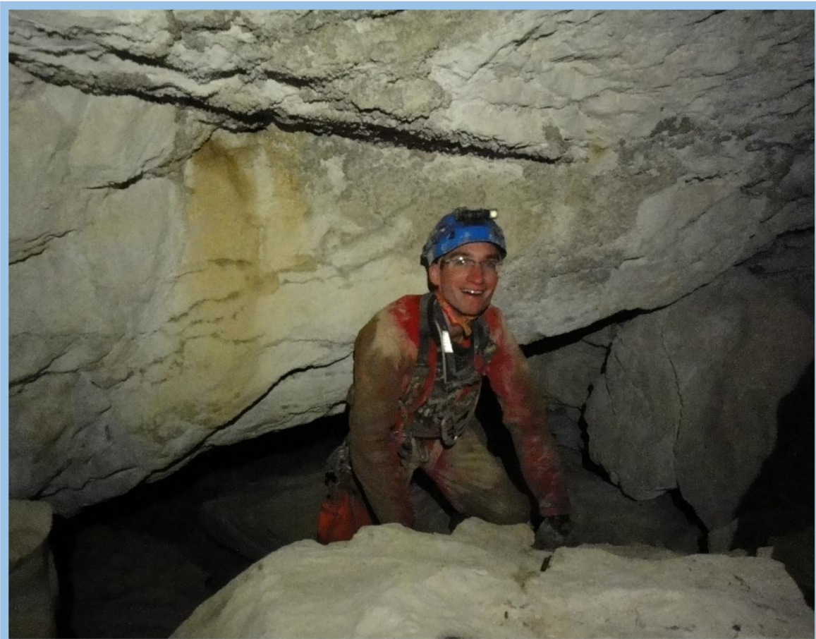
La sortie est proche