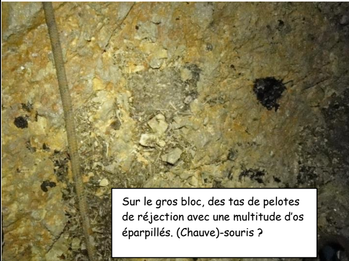
Sur le gros bloc, des tas de pelotes de réjection avec une multitude d'os éparpillés. (Chauve)-souris ?

Nous ne sommes pas les premiers à être venu ici car nous trouvons des spits très