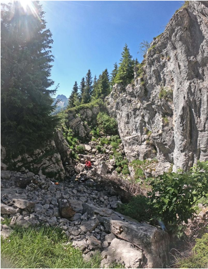
Le site de l'entrée