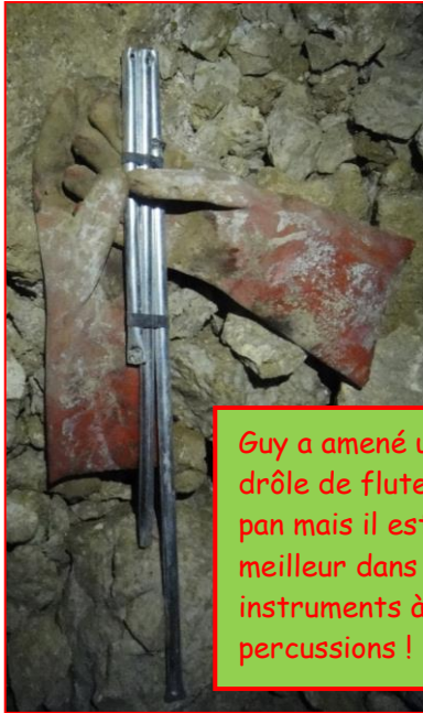
Guy a amené une drôle de flute de pan mais il est meilleur dans les instruments à percussions !