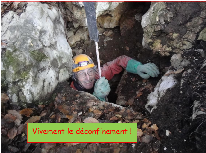
Vivement le déconfinement !