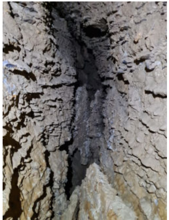
Photo 1 : Ci-contre le type de cheminement principal de l'impasse Berger.

Une fois arrivés devant le P10 de l'impasse Berger, nous voilà devant un mousqueton bien rouillé placé sur goujon et un spit où placer un deuxième point un peu plus récent ! Pas de déviation artif visible, un becquet peut faire l'affaire tout en restant vigilant à la direction emprunter lors de la descente ou remontée. Une C15 est bien suffisante pour équiper cet unique puit inévitable de l'impasse Berger. Nous arrivons alors sur une main courante en plutôt bon état, sur goujons et maillons corrodés mais encore bien épais.