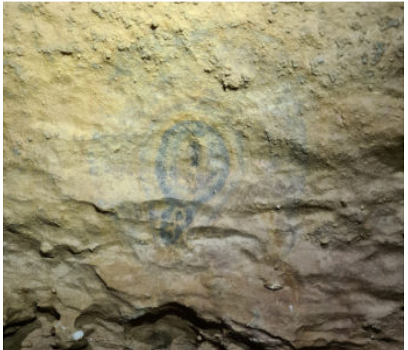
Photos 5 & 6 : Fossile ? De quoi ? Trace acéto bien particulière « peinte » ? Avec et sans échelle.

Voir page suivante pour la topo annotée. Désolé nous n'avons pas pris de photo pour la salle que nous pensons « supplémentaire » avec le boyau sableux orienté Sud 😞 (approximation de tête, longueur boyau Sud 5-7m, hauteur salle 4m largeur 6m longueur 20m).