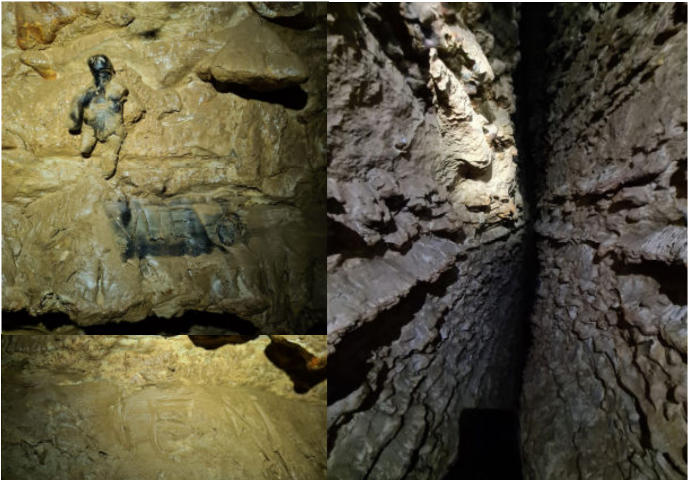
Photos 2,3 & 4 : Zone topo « grande diaclase » avec traces de passages anciens. Signé « O » ?

Après cette MC, il faut chercher à remonter puis continuer dans la diaclase jusqu'à rejoindre une grande salle. Ici il est possible de se faufiler en 3D dans pas mal de diaclases où des éboulements ont remplis la majorité du volume. Les désob des boyaux de sables sont imposantes. Par celle de droite nous pouvons rejoindre la main courante par le bas, par celle de gauche formant un Y nous pouvons sentir un léger courant d'air soufflant venant d'un boyau impénétrable (taille de tête) en haut à droite de la branche de gauche après la fosse creusée. En repartant vers le fond de l'impasse, nous passons devant la grande diaclase (légèrement en hauteur) où peu après s'y être aventuré nous voyons un vigile de glaise (photo ci-dessous). Un marquage dans la glaise et à l'acéto « Vue » puis « Rien » est visible, signé « O » ?