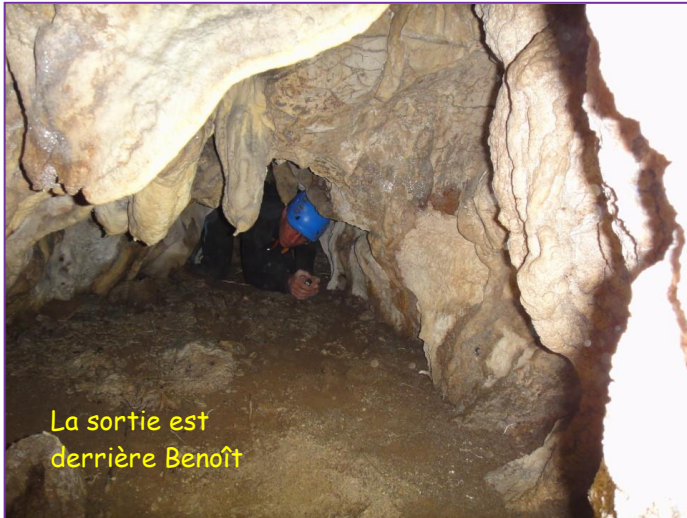
La sortie est derrière Benoît

hostilités, je suggère une pause pique-nique. Même si je ne vois pas le rapport, Benoît déclare ne pas avoir faim après les viennoiseries que nous avons avalées ce matin. J'attaque d'abord avec une corde d'une quinzaine de mètres pour ensuite enchaîner avec une corde de 60 m. J'ai avec moi le perfo pour poser des gougeons de 8 ou forer des trous en 12 pour y passer directement des sangles fines. Pendant que j'équipe, Benoît me suit avec Orka et s'occupe à tailler des marches sur la vire déversante. Arrivée à destination, je tente une première descente qui me permet de localiser où se trouve la cavité. Je dois remonter pour me décaler d'une dizaine de mètres vers l'amont. Hélas, je me rends compte, que ma corde est trop courte : manque une petite dizaine de mètres. Benoît, tel Hermès au pied léger, file récupérer le bout de corde posée en début de main-courante.