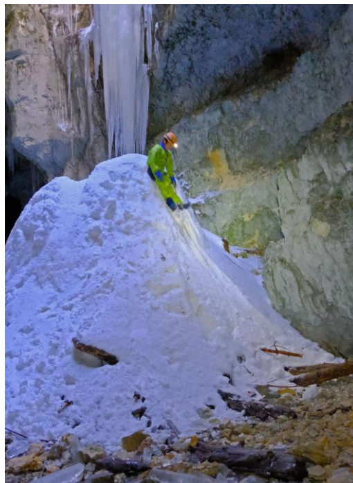
L'art de la glisse !