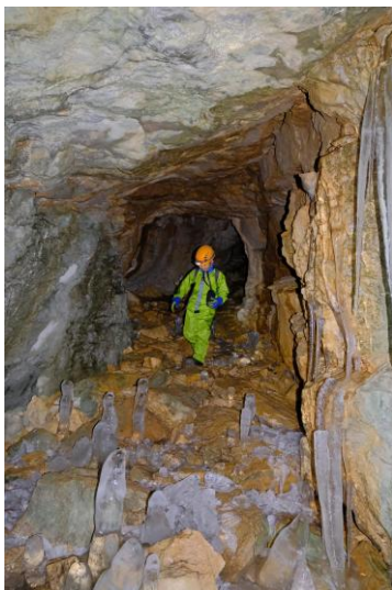
La grotte Sous le Chemin.