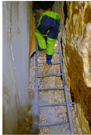
Même l'échelle est gelée !