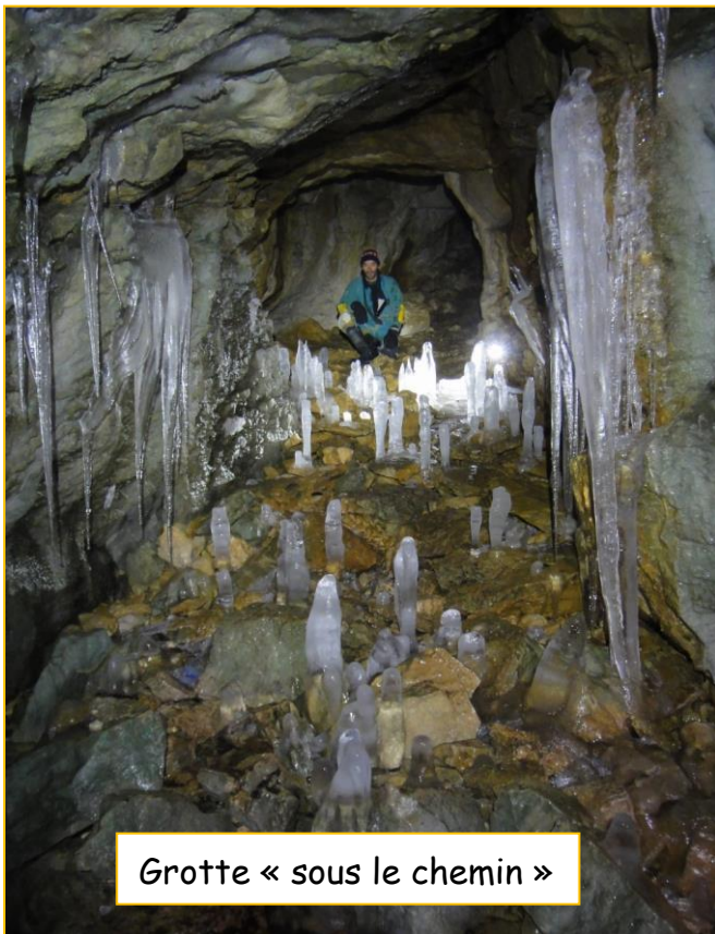
Grotte « sous le chemin »

Nous devons faire preuve d'imagination pour trouver un objectif nous permettant de respecter le couvre-feu. Nous portons notre dévolu sur un trou dans lequel nous ne sommes jamais allé et qui a l'avantage d'être rapidement rejoint à pied avec de plus, un développement ne dépassant pas les 100 m. La grotte sous la piste est située à 50 à l'aval de la grotte sous le chemin dans laquelle nous faisons étape à l'aller pour nous équiper au sec. Des stalactites de glace agrémentent la galerie d'entrée