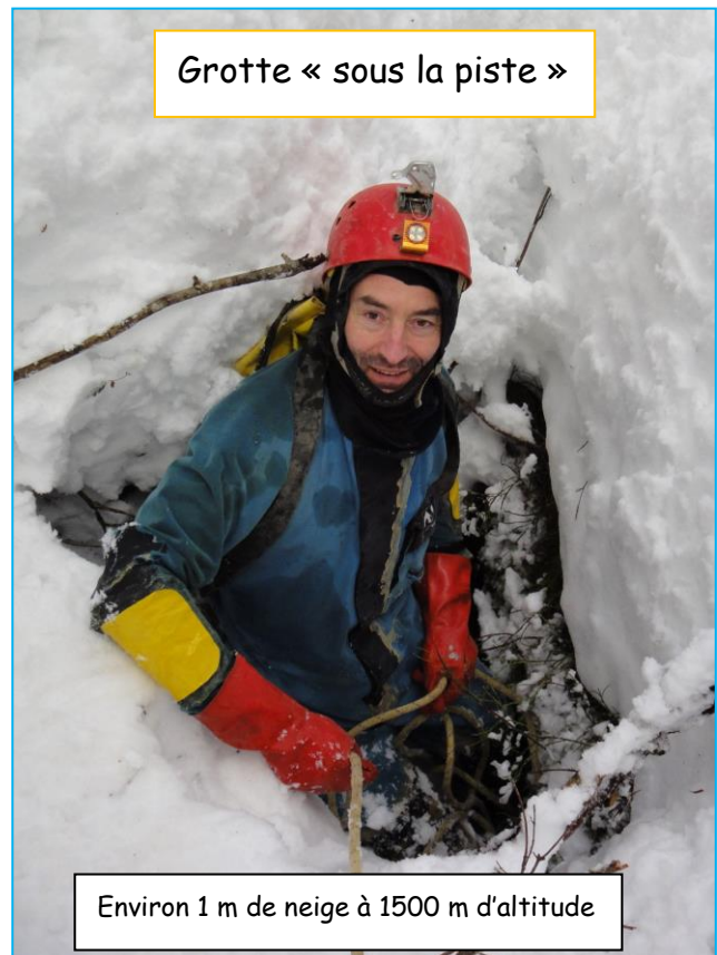
Grotte « sous la piste »

Environ 1 m de neige à 1500 m d'altitude