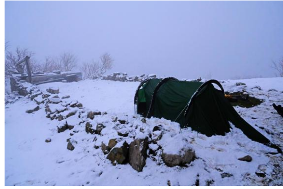
et le lendemain avant de partir.