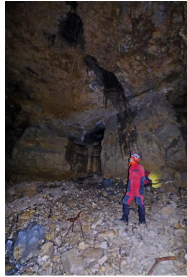
Près du redan de l'entrée principale.