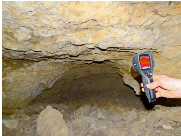
Le recoin le plus chaud, 0,4^{\circ}\text{C} , entre les entrées.