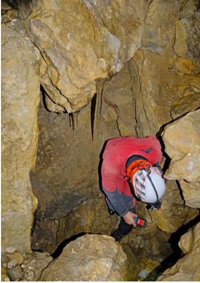
Au point bas...

Nous entrons par l'entrée inférieure qui permet d'accéder à la salle sans matériel. Nous allons ausculter tous les recoins sans trouver de secteur franchement plus chaud, la température relevée oscille partout entre -1^{\circ}\text{C} et -0,5^{\circ}\text{C} , y compris au point bas. Une petite couche de glace translucide recouvre une bonne partie de l'éboulis.