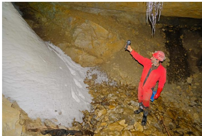
Premier essai de mesure.