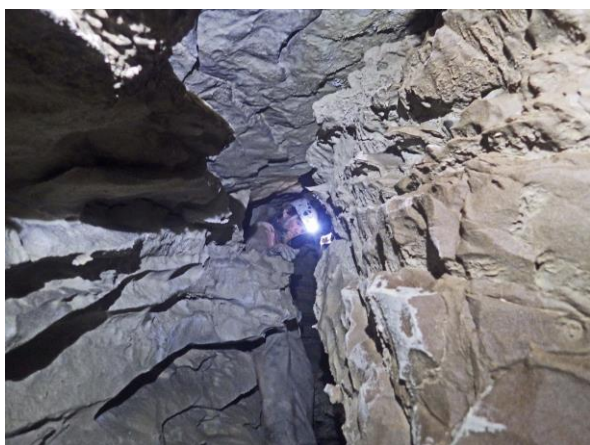
Christophe en amont de l'escalade vers le fossile.