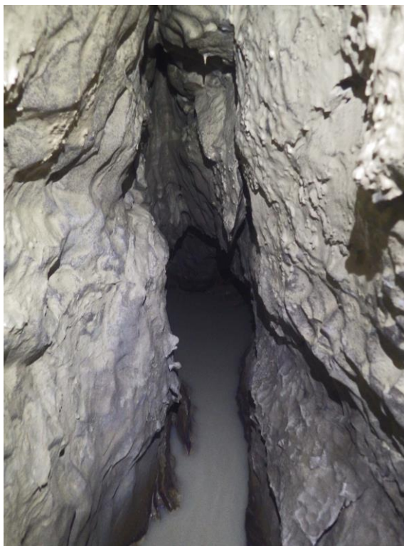
Au bout à droite, la « voûte basse ».