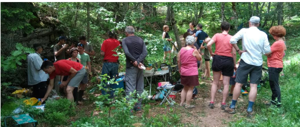
Vision champêtre à la sortie...