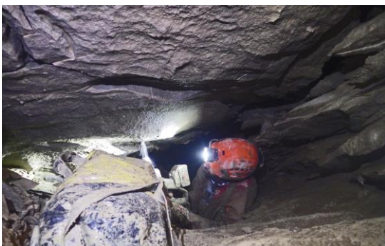
Bertrand à l'équipement...

Enfin une accalmie dans cette période orageuse ! Il faut en profiter pour La Combe, et nous voilà donc de retour de bon matin. Optimistes, nous emportons une corde et pas mal d'amarrages malgré tout ce qui reste déjà au fond. La marche d'approche passe bien grâce aux bavardages sur la flore « carnivore » de notre région et dès 9 h \frac{3}{4} nous nous immergeons dans la cavité nettement plus humide qu'il y a 9 jours. Cela met de l'ambiance sans présenter de problème. Encore quelques aménagements ponctuels, échanges de mousquetons pour des maillons inox, grattage du boyau de -260, déblayage en bas du Puits Pernod, et à -315 nous trions et répartissons le matériel. Puis avec Didier je pars topographier le terminus actif inférieur tandis que Bertrand et Domi installent au sol un plastique dans le boyau supérieur, ce qui améliore grandement son passage. Puis ils équipent et nettoient les ressauts qui suivent, c'est là que nous les retrouvons et les seconderons. Puis direction le terminus connu, massette et marteau s'agitent tout le long pour casser les lames omniprésentes et faciliter le passage en ménageant les combinaisons ! Comme nous avons aujourd'hui un expert en équipement, j'ai nommé Bertrand, nous le laisserons œuvrer pour tous les puits et redans, et le reste de l'équipe s'occupe de la topo et du soutien logistique.