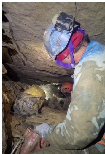
... sous l'œil de Domi .