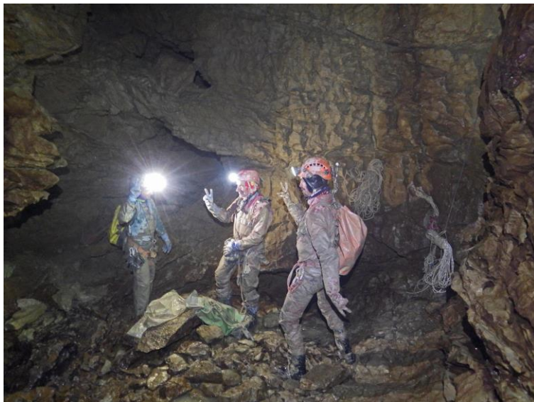
les trois mousquetaires (4 avec le photographe !).

L'heure a tourné, l'étroiture clef de ce réseau demandera un aménagement sérieux pour la suite sereine des explos. On décide d'en rester là, tri du matériel et photo-souvenir dans la salle !