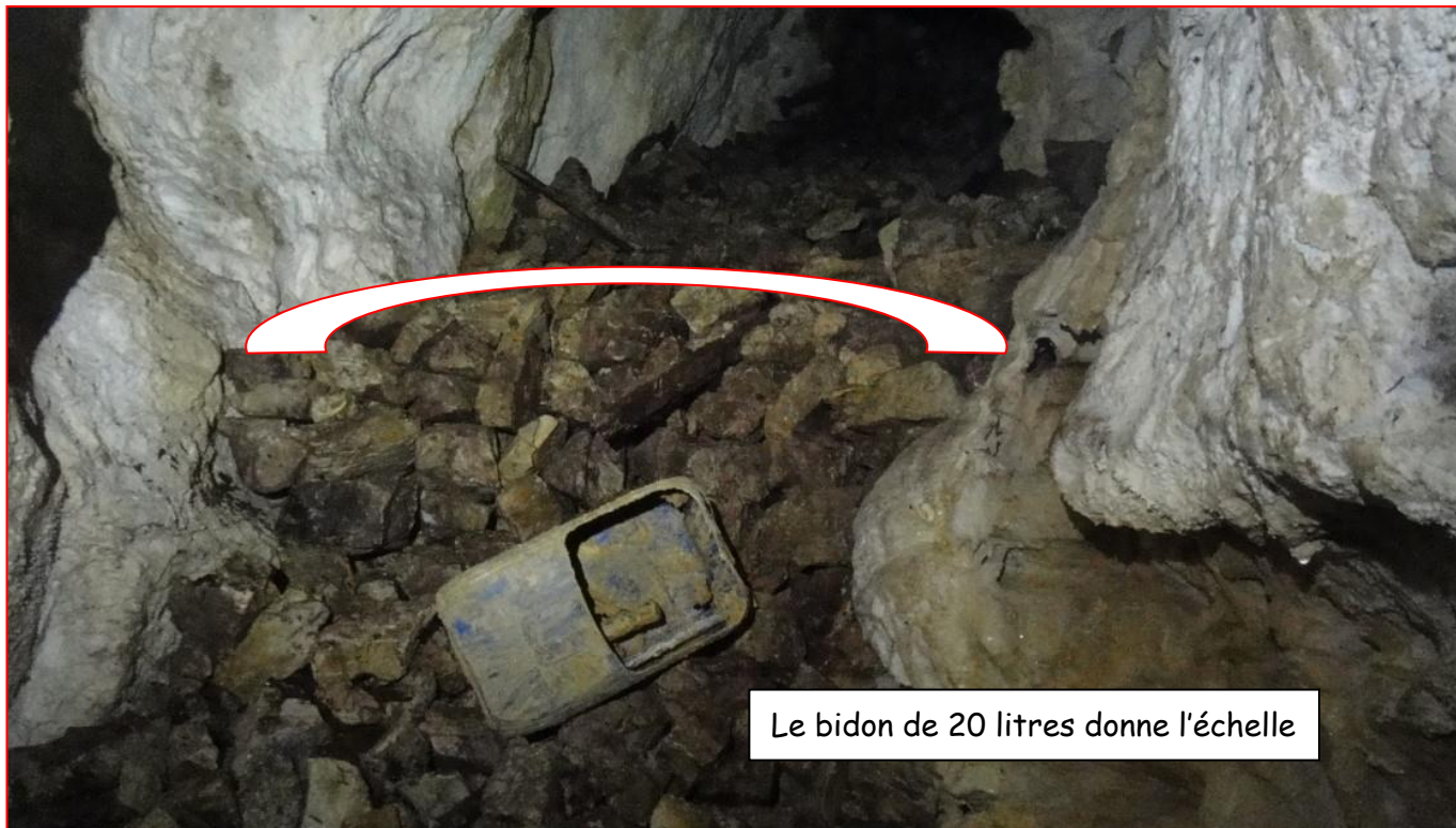
Le bidon de 20 litres donne l'échelle