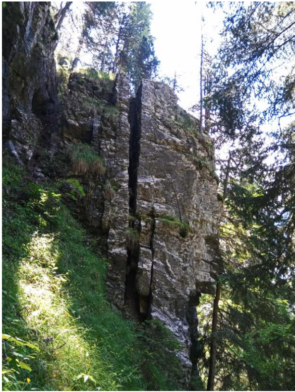
Strates de faciès variés.