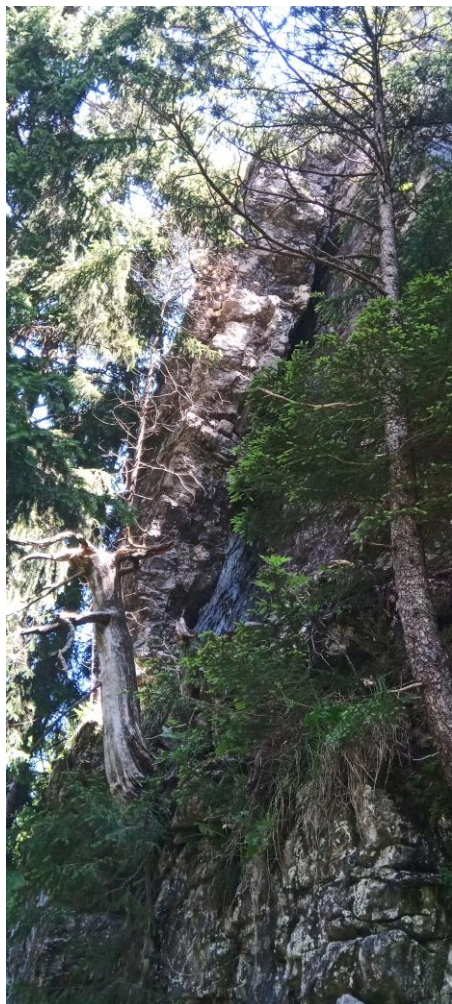
La strate en équilibre...