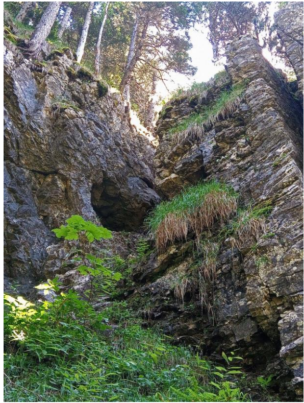
Un porche en hauteur, à voir.