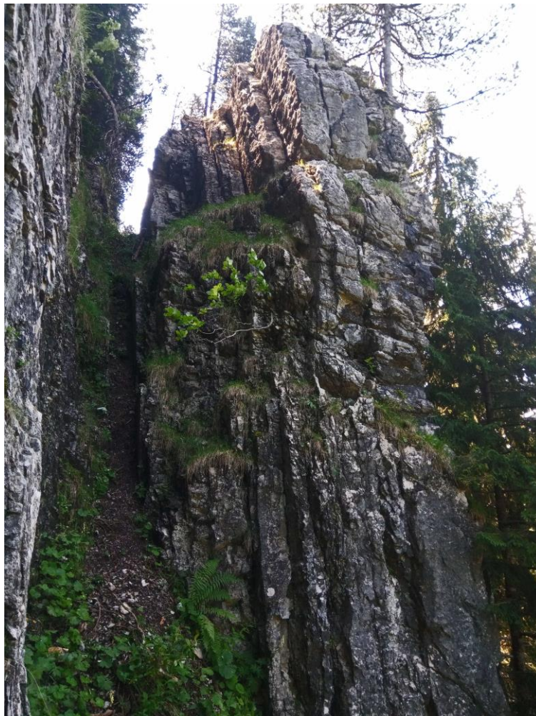
Pendage vertical !