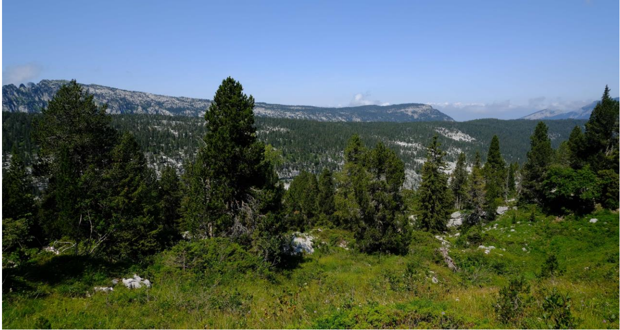
Du secteur présumé du « P70 », vue sur tout le plateau du Parmelan.

Le trou s'ouvre dans les strates presque verticales, il faudra le revoir à l'occasion. Ensuite je poursuis vers le Sud, traverse les lapiaz sous les trois « Têtes » évoquées plus tôt, cette fois à la recherche d'une glacière, cotée -70, explorée en 1976 par le SC Vizille. Ce n'est pas la première fois que je cherche ce trou, à revoir vu le réchauffement climatique. En prospectant en hiver (avec Alain Marbach) j'avais repéré des trous souffleurs pouvant correspondre à la cavité. Mais je ne trouve rien de probant. Retour par la belle vallée d'Ablon.