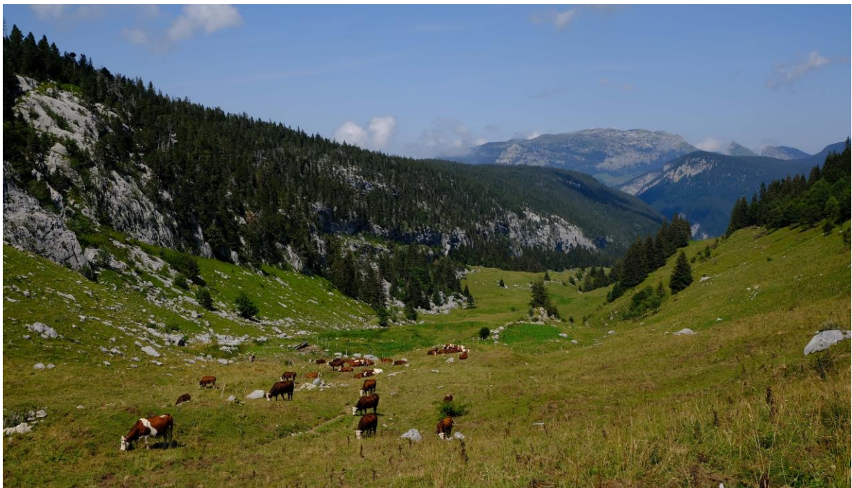
La vallée d'Ablon, au fond le massif de Sous-Dine.